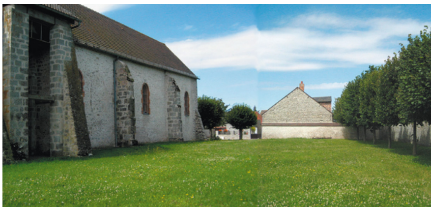
L'espace public de l'église Saint-Pierre / Saint-Paul

Le règlement du PLU identifie et localise aux documents graphiques ces éléments bâtis (2) pour les préserver et les mettre en valeur.