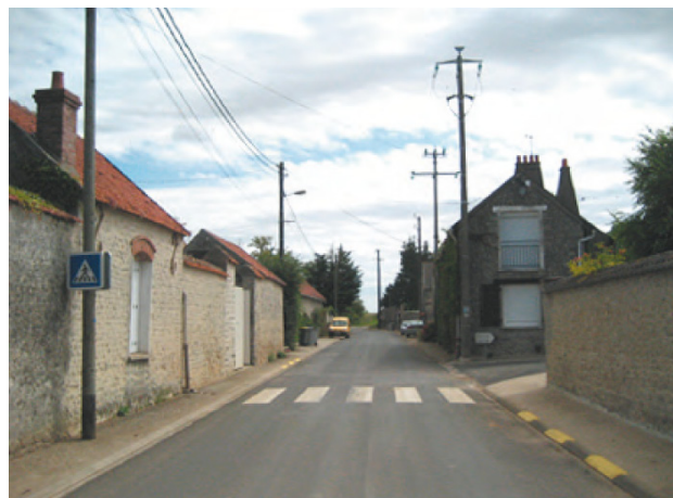
Des implantations à l'alignement et des murs aveugles