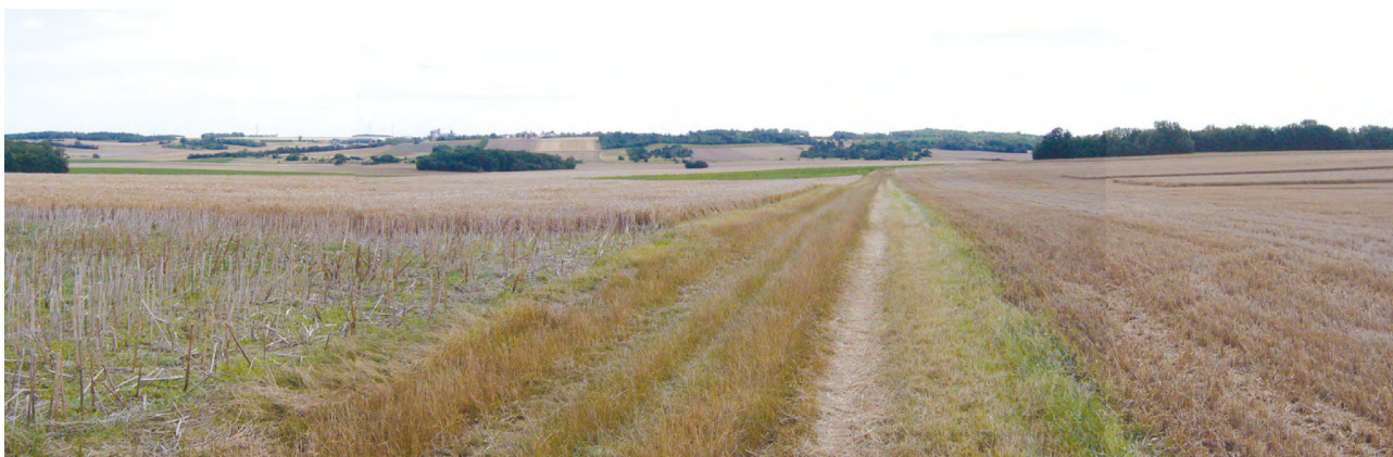
Les vallées sèches et les déplacements agricoles

Le PLU précise le tracé des voies de circulation à modifier ou à créer en fixant des emplacements réservés (5).