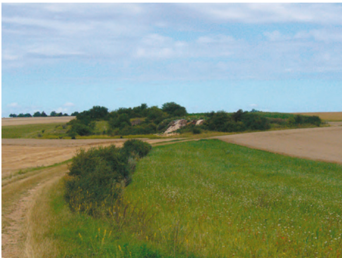
L'ancienne carrière utilisée partiellement comme décharge pour les gravats

Le PLU réserve un ou plusieurs sites identifiés par la mise en oeuvre d'un emplacement réservé(5).