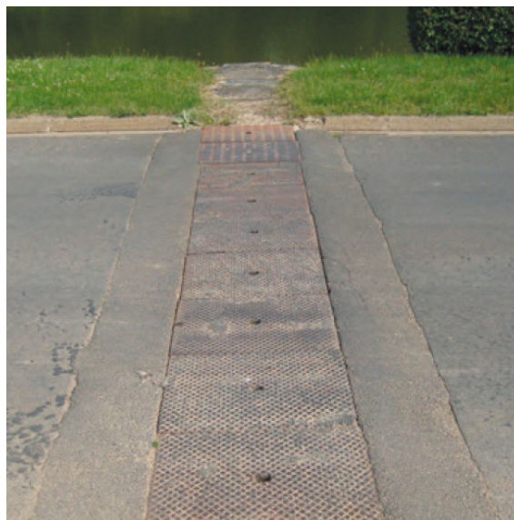
Ecoulements des eaux pluviales à proximité des mares