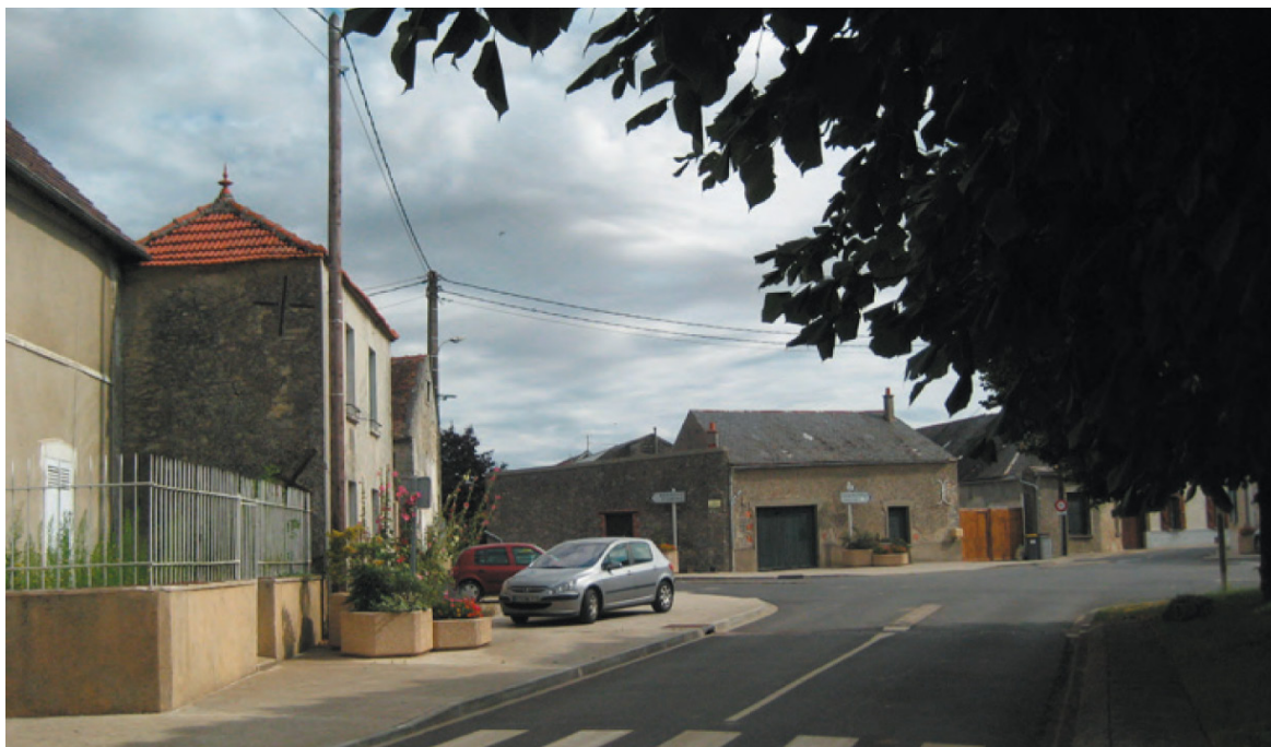
La place centrale de Brouy

Pour préserver la qualité de l'espace bâti du village et du hameau, le règlement du PLU identifie et localise aux documents graphiques les éléments et ensembles remarquables et notamment les alignements de constructions à conserver et/ou à créer (2).