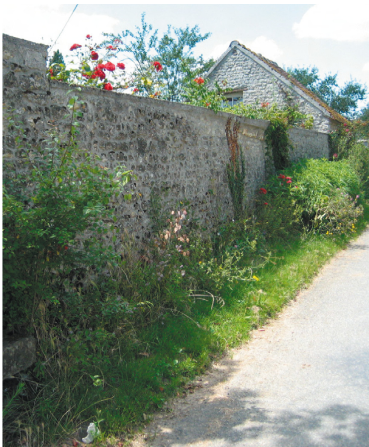
Des bandes plantées en pleine terre au pied des murs

Le PLU régleme les espaces libres pour lutter contre l'imperméabilité des sols.