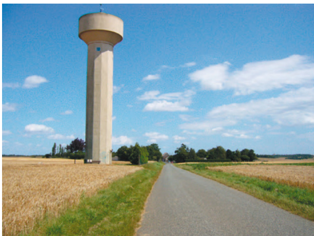
Le château d'eau

Le règlement du PLU identifie et localise aux documents graphiques ces éléments de paysage à protéger (2).