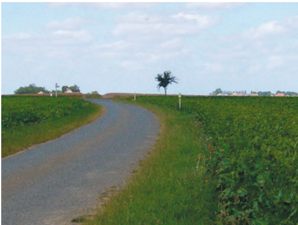
Le jeune orme qui marque le carrefour de Fenneville / Brouy

Le règlement du PLU identifie et localise aux documents graphiques les lieux emblématiques et les éléments du patrimoine paysager (2) du village et du hameau.