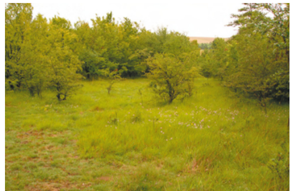
Pelouse calcicole « les bois de la Meule »