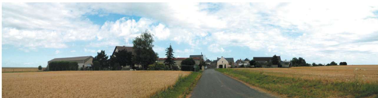
L'entrée Sud du village

Aussi, le PLU ne comporte-t-il pas de zone d'urbanisation future (AU) et les potentialités de constructions neuves sur des terrains en zone urbaine se limitent à 4 ou 5 constructions.