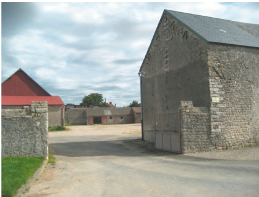
Grande ferme à cour

Néanmoins, le PLU n'identifie aucun bâtiment agricole situé en zone A et susceptible d'un changement de destination pour des motifs architecturaux ou patrimoniaux