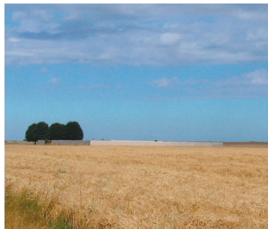
le mur d'enceinte du cimetière