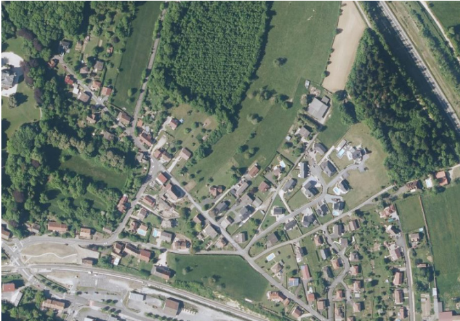
Vue aérienne et vue du secteur depuis la rue de la Fontaine aux Voix