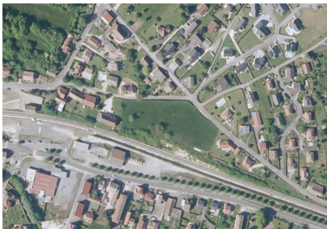
Vue aérienne et vue du secteur depuis la rue de la Fontaine aux Voix