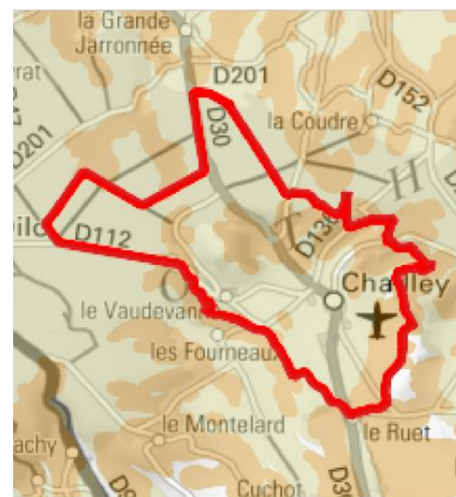
Les risques à prendre en compte sur le village

La commune de Chailley est concernée par des risques naturels. La commune a déjà connu un épisode d'inondations et de coulées de boue. De plus, il est à noter que la commune est classée en aléa faible et moyen pour le risque de retrait-gonflement des argiles. La commune, de part son bassin versant, est également concernée par le Programmes d'actions de prévention contre les inondations (PAPI) de l'Armançon approuvé le 15 octobre 2015.