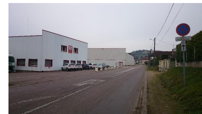
Entreprise DUC (PLUKON) au Sud du Bourg

Ainsi, en limitant ses nuisances, la zone d'activités existante sera renforcée dans sa fonction d'accueil d'entreprises nouvelles afin de dynamiser le secteur économique du territoire.