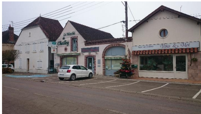
Les commerces du village