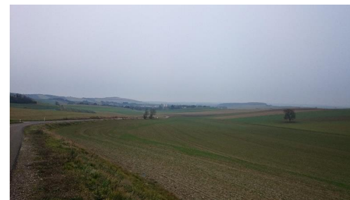
Les milieux agricoles à préserver sur le territoire

La préservation du caractère rural du village est un objectif important qui s'illustrera notamment par un zonage donnant une place importante aux zones agricoles et naturelles.