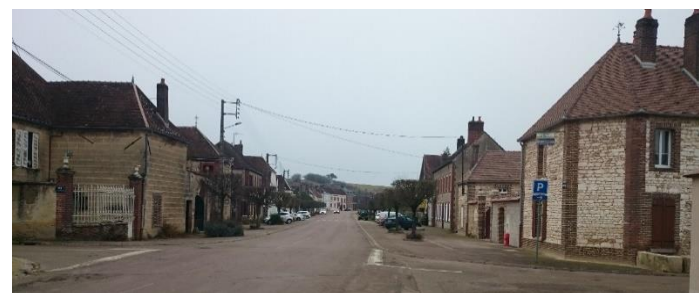
Traversée du village par la RD 30

Il faut améliorer la transition entre les zones agricoles et les franges bâties par une amélioration de la qualité paysagère en parallèle de la prise compte de la sécurité routière.