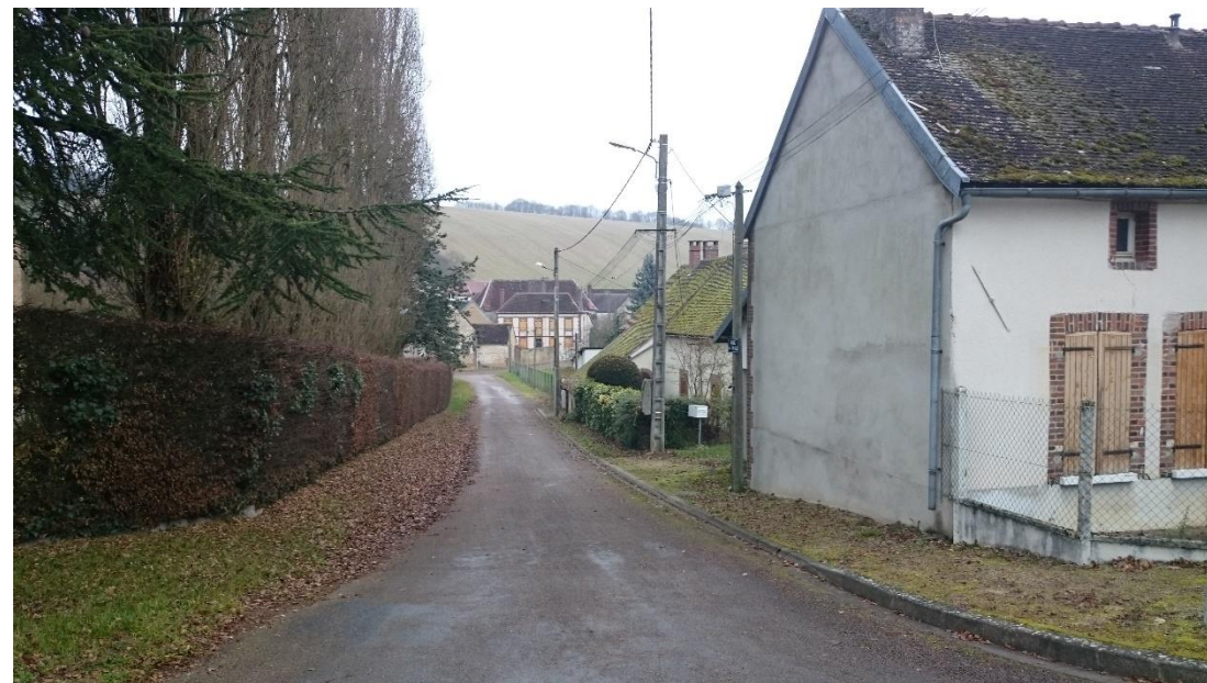
Fenêtre sur l'espace agricole à Vaudevanne