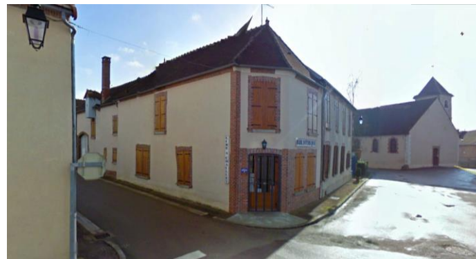
Centre ancien avec la bibliothèque et l'église