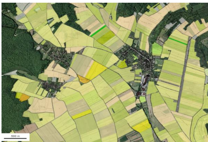
Les espaces agricoles soulignés par les boisements en périphérie

Le développement économique local passe par le développement de l'entreprise DUC (PLUKON) et Othe Rangement, leur extension entraîne une consommation minimale de terres agricoles (6,2 ha soit moins de 0,7 % de la SAU et 0,37 % du territoire communal), Cette consommation de terres agricoles est en grande partie liée au développement de la filière avicole locale (extension du parking PLUKON).