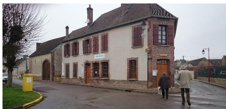
Place de la mairie et la poste