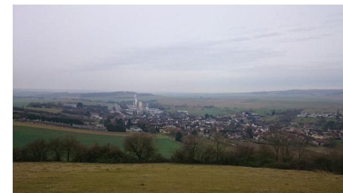
Les milieux naturels à préserver sur le territoire

L'importance des jardins, des pâtures en milieu urbain, permet encore aujourd'hui une continuité assurant un maillage vert de qualité. Il convient de renforcer et de conforter ce maillage existant, source de diversité, et de créer une véritable ceinture verte efficace, conjointement à la création d'un véritable réseau de liaison douce (tour de village, chemins ruraux) participant à sa reconnaissance par la promenade (site de la Chapelle de la bonne mort).