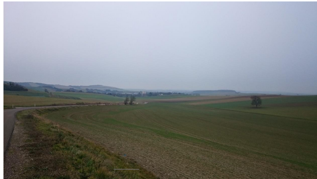
L'espace agricole avant d'arriver dans le bourg par la RD 30