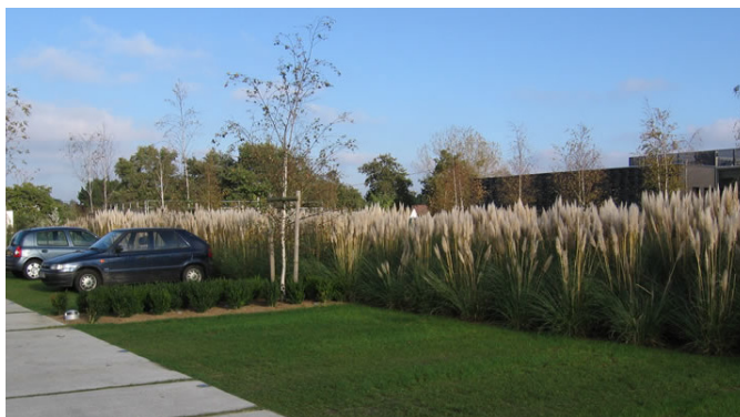
exemple de parking végétalisé