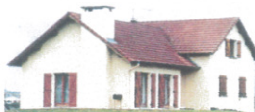
Maison contemporaine d'une architecture « banalisée »

La logique du respect de l'architecture doit être retenue pour obtenir un territoire cohérent. Le respect des aspects architecturaux peut permettre de conserver une harmonie dans le village.