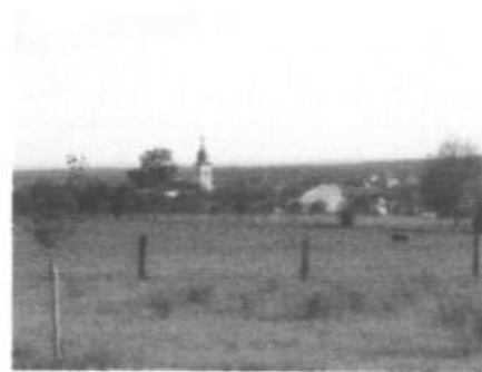
Vue depuis chemin communal au dessus du cimetière