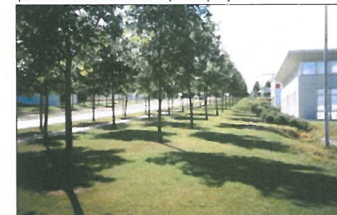
zone artisanale à Amiens (80)