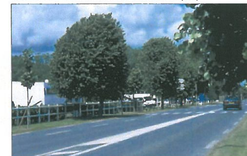
parc d'activités à Bayeux (14)