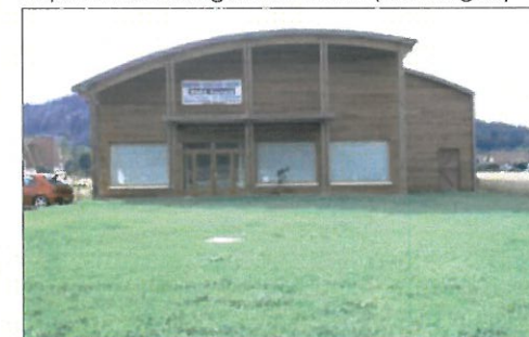
bâtiment artisanal à St Léonard (88)