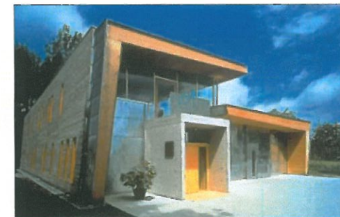
imprimerie à Langensteinbach (Allemagne)