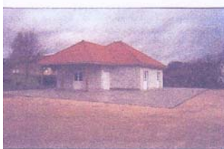
Maison des Association