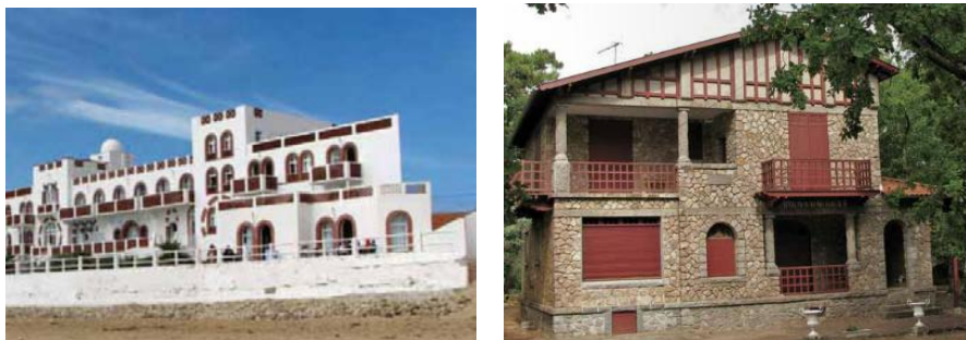
Exemples de patrimoine bâti balnéaire typique de la côte vendéenne

les styles architecturaux : régionalisme néo-basque et provençal, influence orientale, architecture d'influence naturaliste-moderniste, etc.