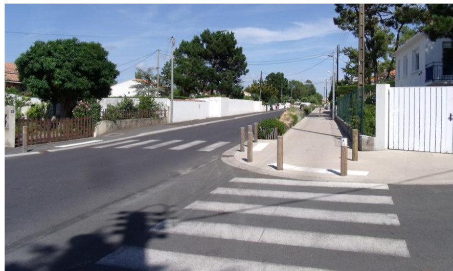
Exemples d'aménagement de voies douces