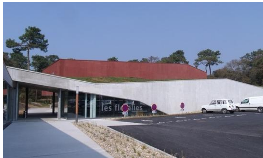
Pôle culturel les Floralies

La commune possède actuellement une offre en équipements de bon niveau qui se concentre au sein du centre-ville. A moyen terme, l'évolution programmée de la population communale n'engendrera pas de besoins conséquents en termes d'équipements.