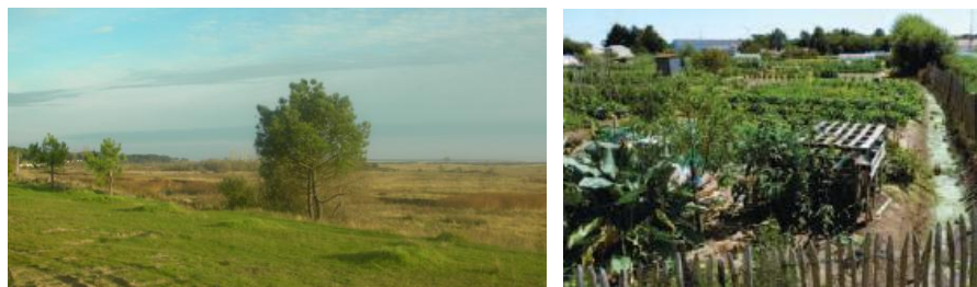
Exemple de paysages emblématiques de la commune

Cette volonté se manifeste par la mise en valeur des paysages les plus emblématiques de la commune, préservés au titre de leur valeur paysagère exceptionnelle (dune, lagune de la Belle-Henriette, marais Poitevin, forêt domaniale de Longeville, les Planches, quartier de La Grière arboré). Le PADD de La Tranche sur Mer s'inscrit également dans