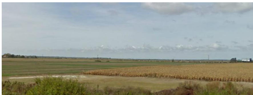
Zone agricole cultivée, Bd Mal de Lattre de Tassigny

L'agriculture tranchaise est en net déclin, n'occupant plus que 15% du territoire communal. Or, l'activité agricole participe au reflet de la diversité de la commune. Afin de favoriser la pérennité de l'agriculture existante et de la renforcer dans sa diversité, seront définies dans le PLU des zones agricoles pérennes, dans lesquelles seule l'activité agricole pourra se développer. À l'intérieur de ces zones, les sièges et bâtiments d'exploitation seront protégés.