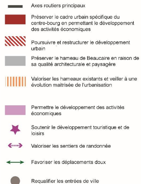
Schéma de spatialisation des orientations urbaines, économiques et agricoles