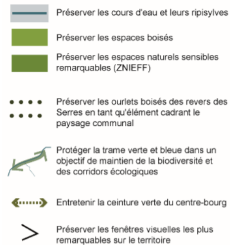
Schéma de spatialisation des orientations environnementales et paysagères PLAN LOCAL D'URBANISME