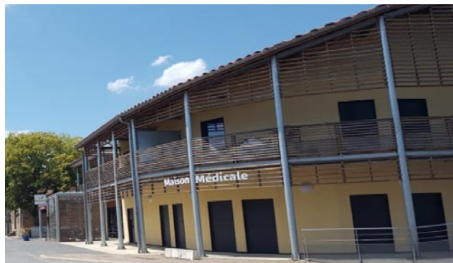
Maison médicale de Valdériès