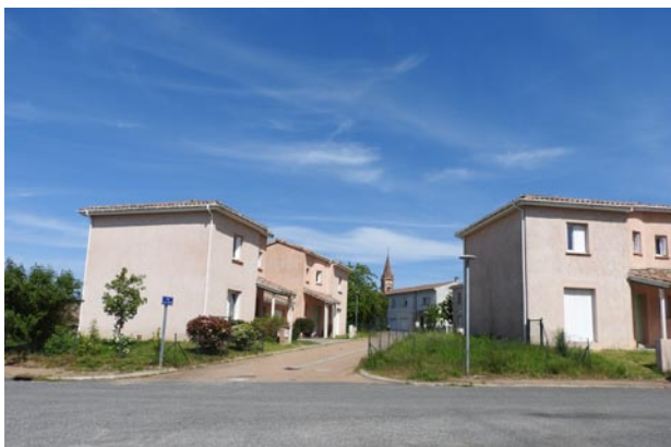
Lotissement - Valdériès