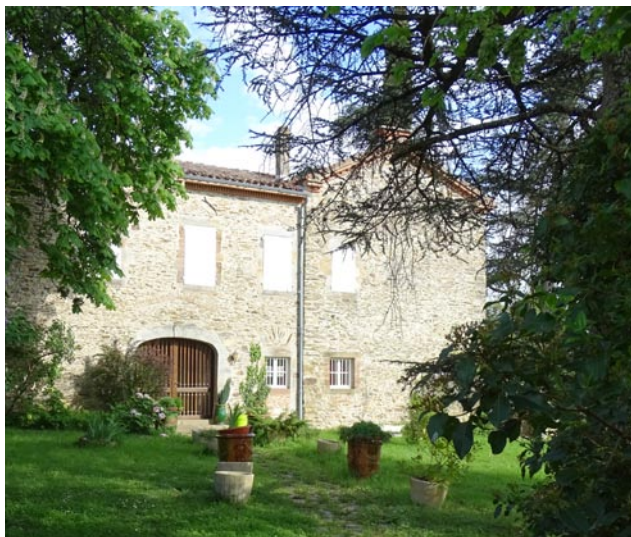
Rénovation - Begous

Eviter la production standardisée de logement, en encourageant la construction d'habitat diversifié sous réserve d'une implantation adaptée (covisibilité, intégration paysagère, etc) et d'une desserte conforme en réseaux.