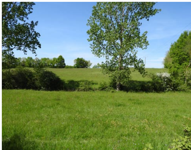
Paysage - Valdériès