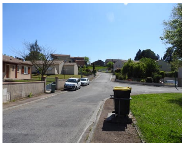
Lotissement - Valdériès