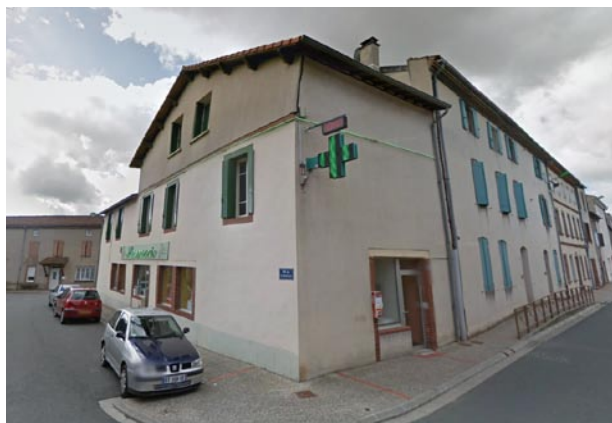
Rue Jean Jaurès - Valdériès