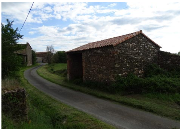
Entrée hameau - La Calmette