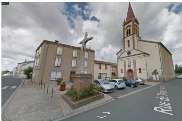
Rue du Vieux Faubourg - Valdériès