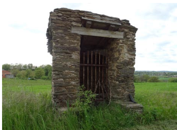
Petit patrimoine rural sur Valdériès (Begous)