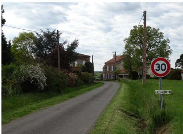
Entrée hameau - La Calmette

Définir et valoriser des respirations paysagères et limites à l'urbanisation afin de préserver le caractère naturel de certains secteurs.