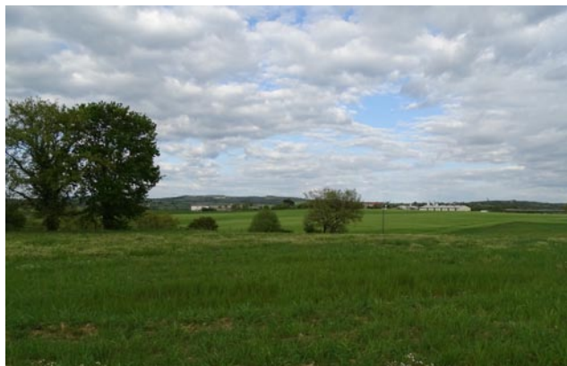
Paysage agricole - La Calmette