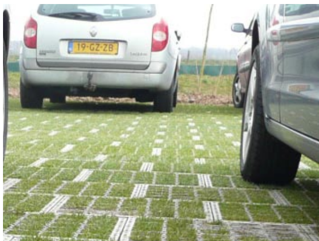
Les dalles engazonnées donnent l'assurance d'un revêtement stable, propre à supporter le poids des véhicules, sans altérer la perméabilité du sol.