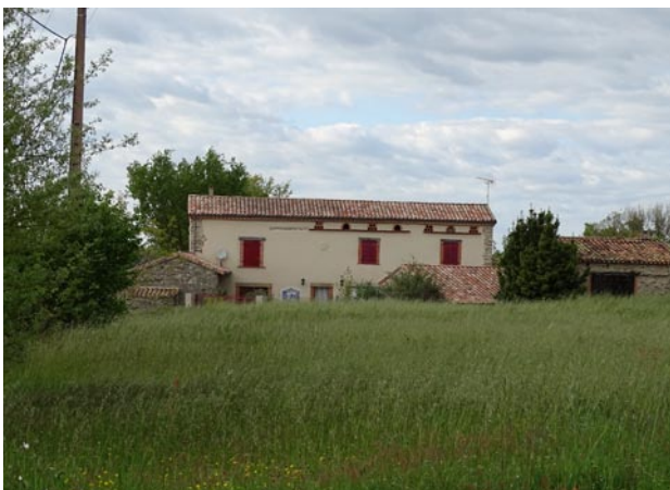
hameau - La Calmette