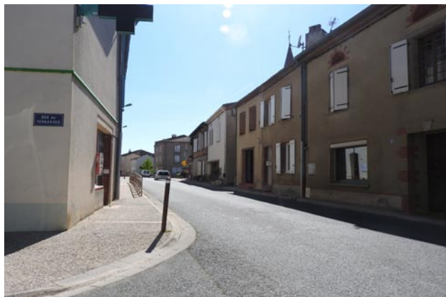
Bourg - Valdériès