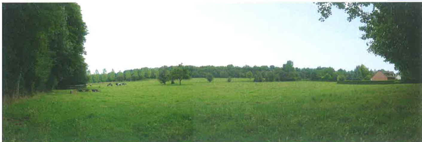
Perspective depuis la rue des Prés