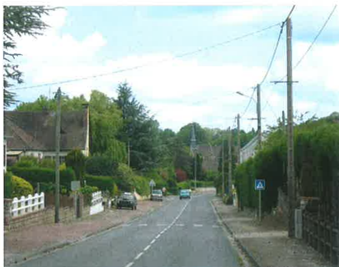
Perspective sur l'église de l'Heure depuis l'axe majeur de communication