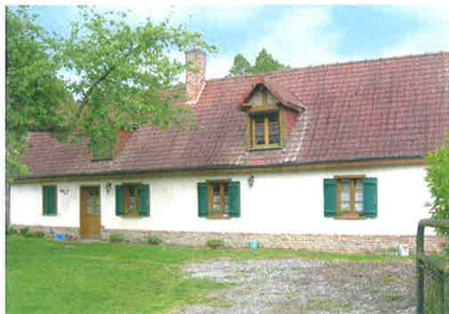
Rue du Sac