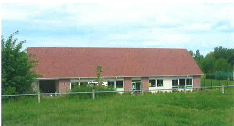
École sur l'Heure