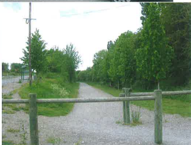
Signalétique et abords de la Traverse du Ponthieu depuis l'HEURE