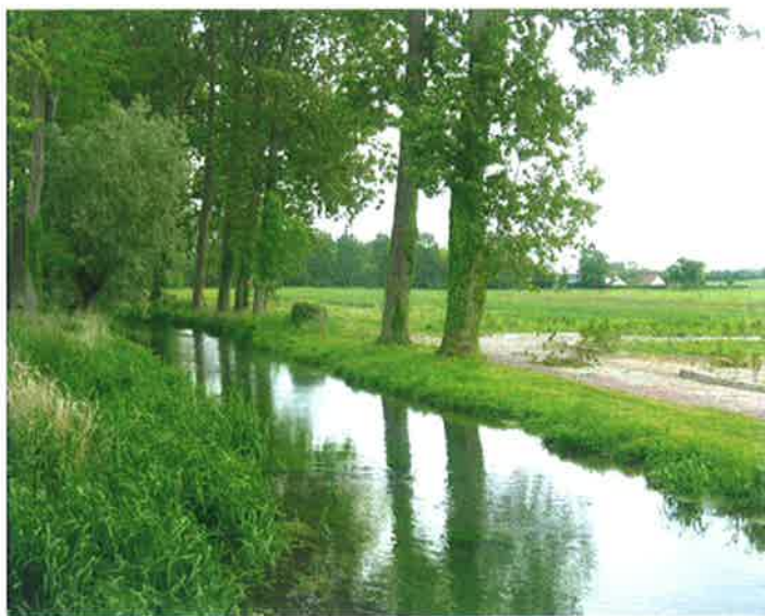
La rivière du Scardon