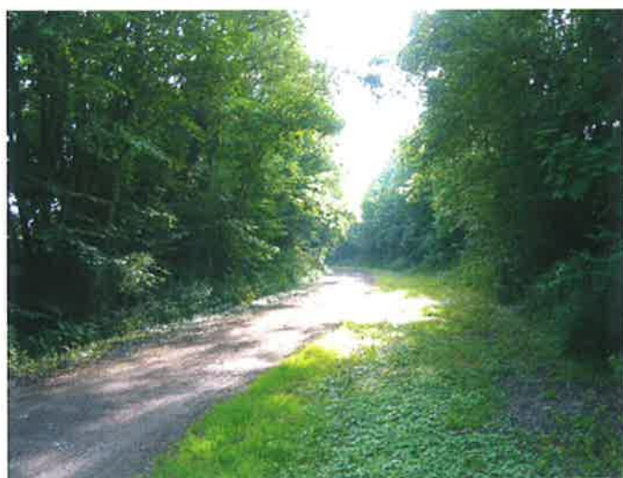
La Traverse du Ponthieu