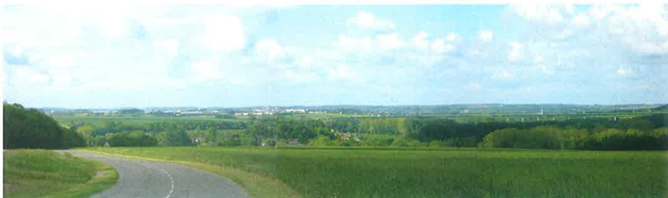
Perspective sur la commune depuis Le Rucher