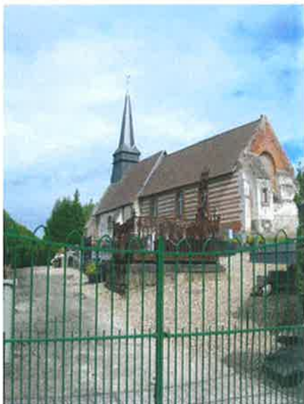
L'église de l'Heure