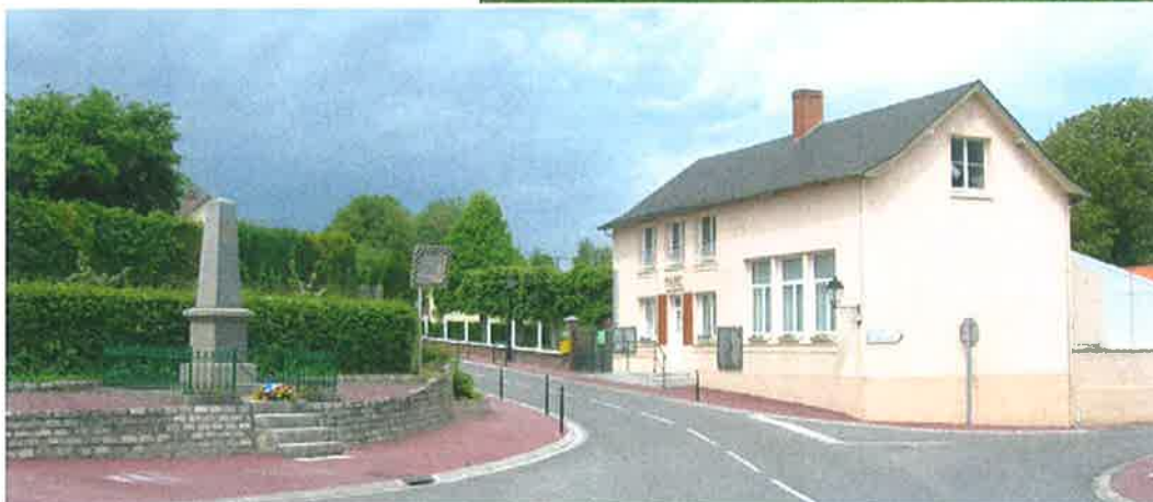
Espace central de CAOURS