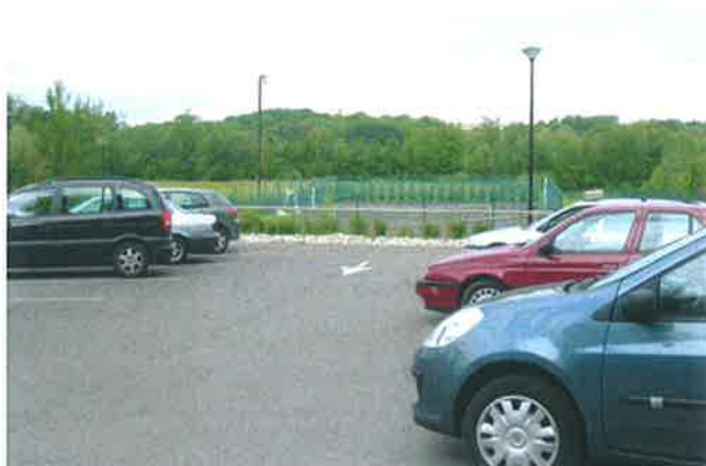
Aire de stationnement et Terrain de tennis sur l'HEURE