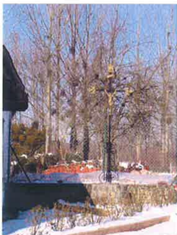
Calvaire, Grande Rue