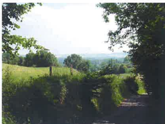
Chemin de la Longue Voie