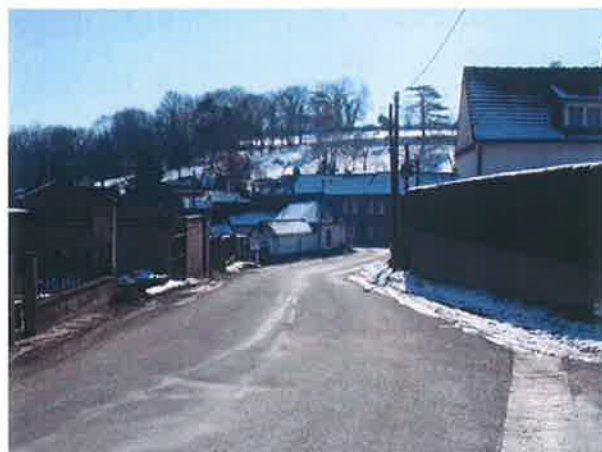
Route Départementale n°3