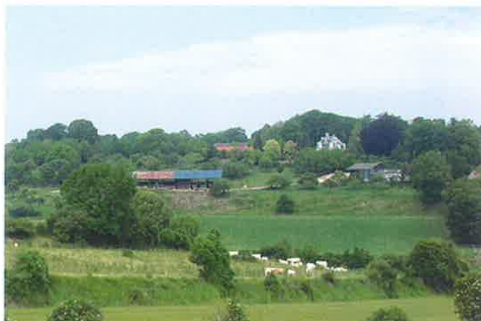
Exploitation agricole, rue du bois Jean Debray