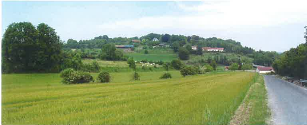
Vallée sèche de la longue Voye en venant de Bellifontaine