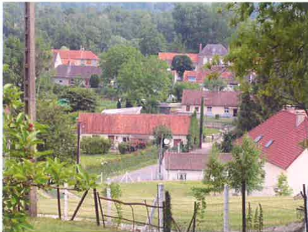
Perspective depuis les premières pentes du versant Sud