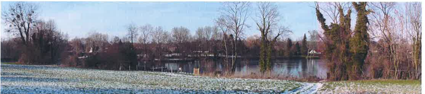
Perspective en entrée d'agglomération, depuis Liercourt