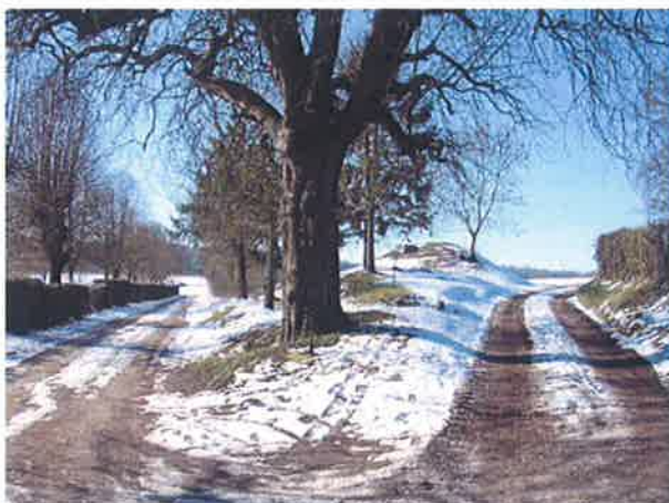
Chemins prolongeant la rue Jean Debray