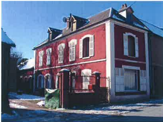
Route Départementale n°3