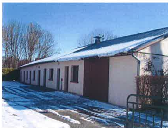
Salle des fêtes