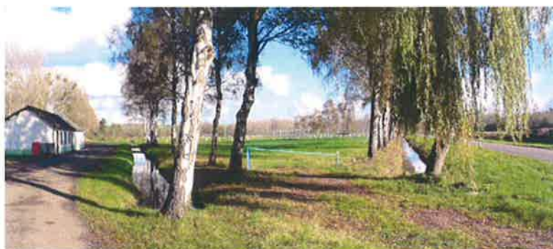
Terrain de Sport