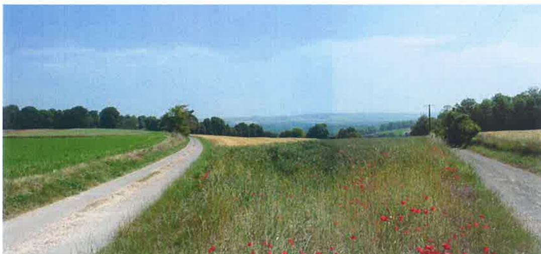
Vue depuis le croisement du chemin de Limeux avec celui des Glinettes