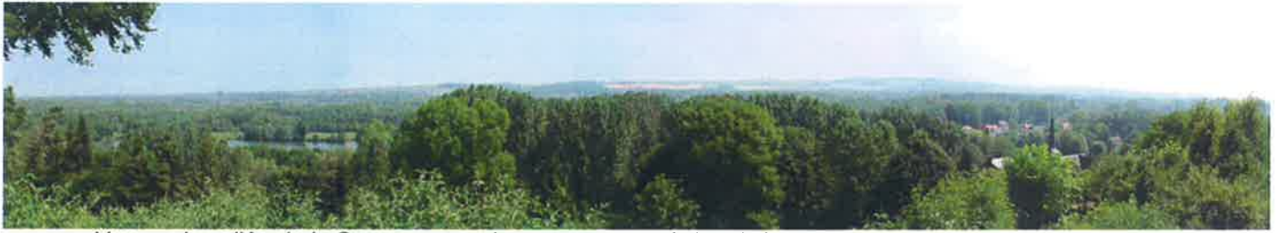
Vue sur la vallée de la Somme et sur le versant opposé depuis les hauteurs de BRAY-LÈS-MAREUIL