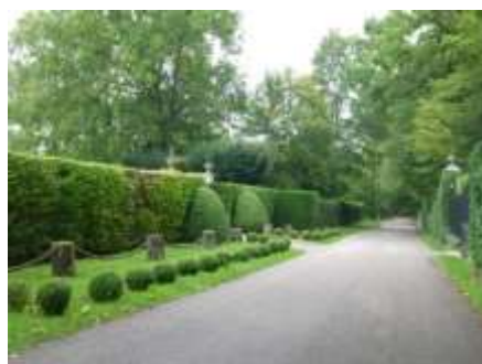
Parc du château