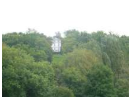
Château de la Tournelle (XIXe)