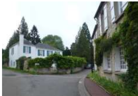
Maison de village