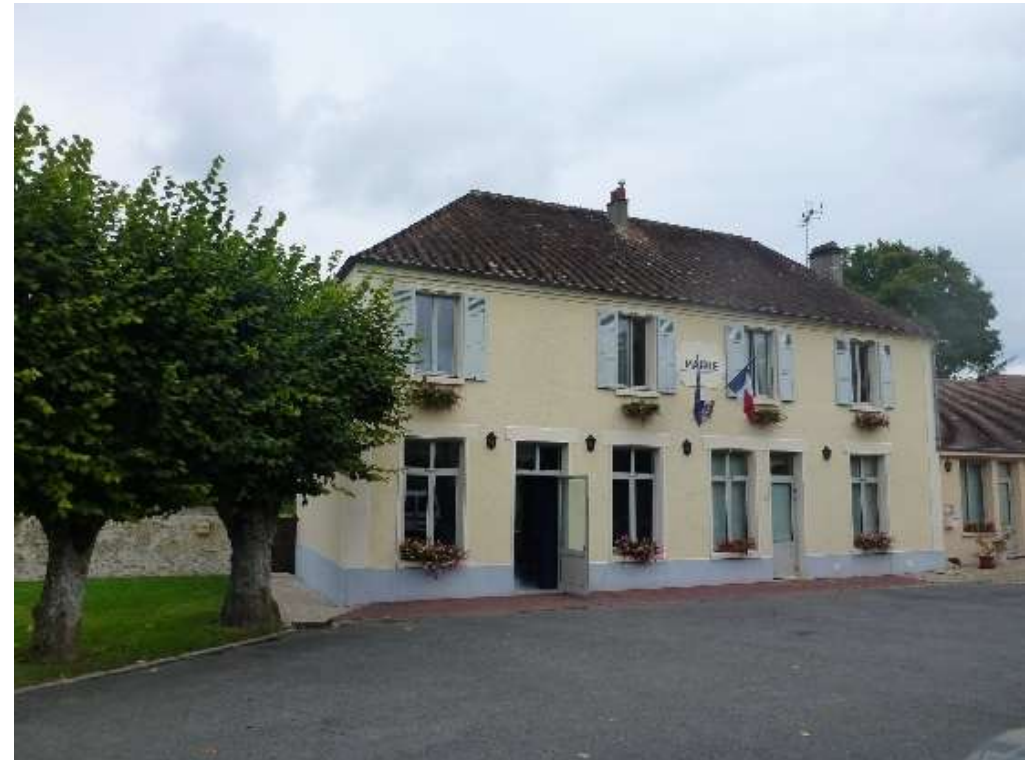
Préserver les équipements actuels et anticiper les besoins futurs