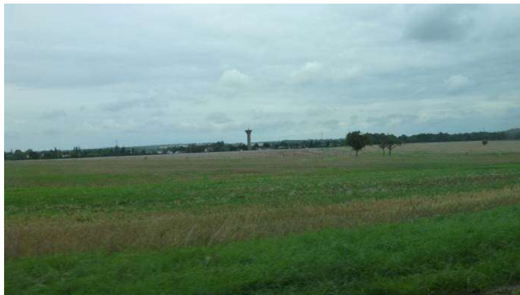
Préservation des plateaux agricoles