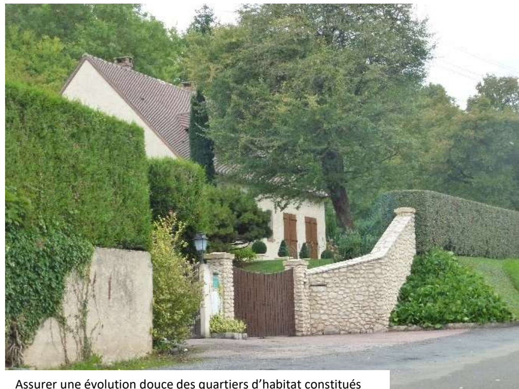
Assurer une évolution douce des quartiers d'habitat constitués