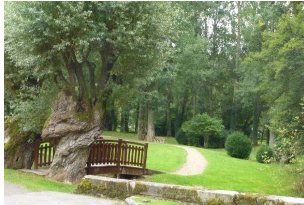
Valoriser les cheminements piétons