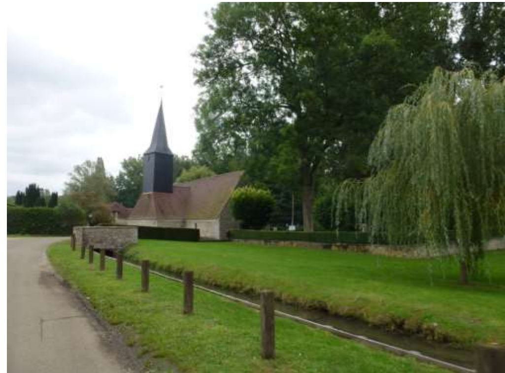
Protection de l'église Sainte-Clotilde (XIIIe siècle) et ses abords paysagers