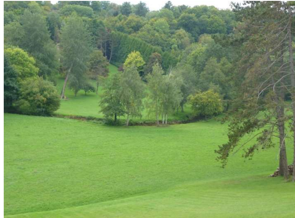
Protection de la zone humide du fond de vallée et des coteaux calcicoles