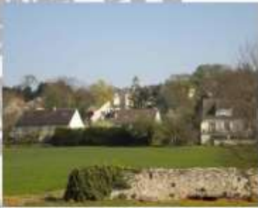
Commune du Département de Seine et Marne