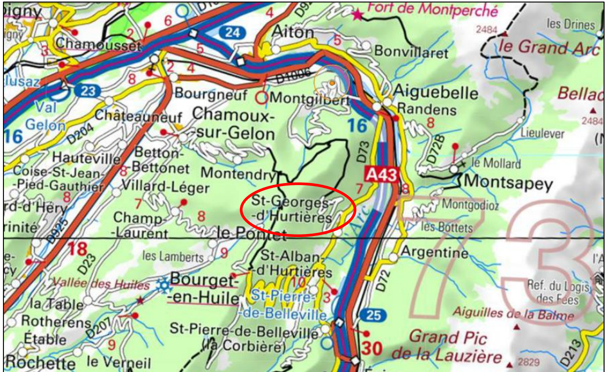
Figure 1 : Localisations de la commune concernée par l'étude