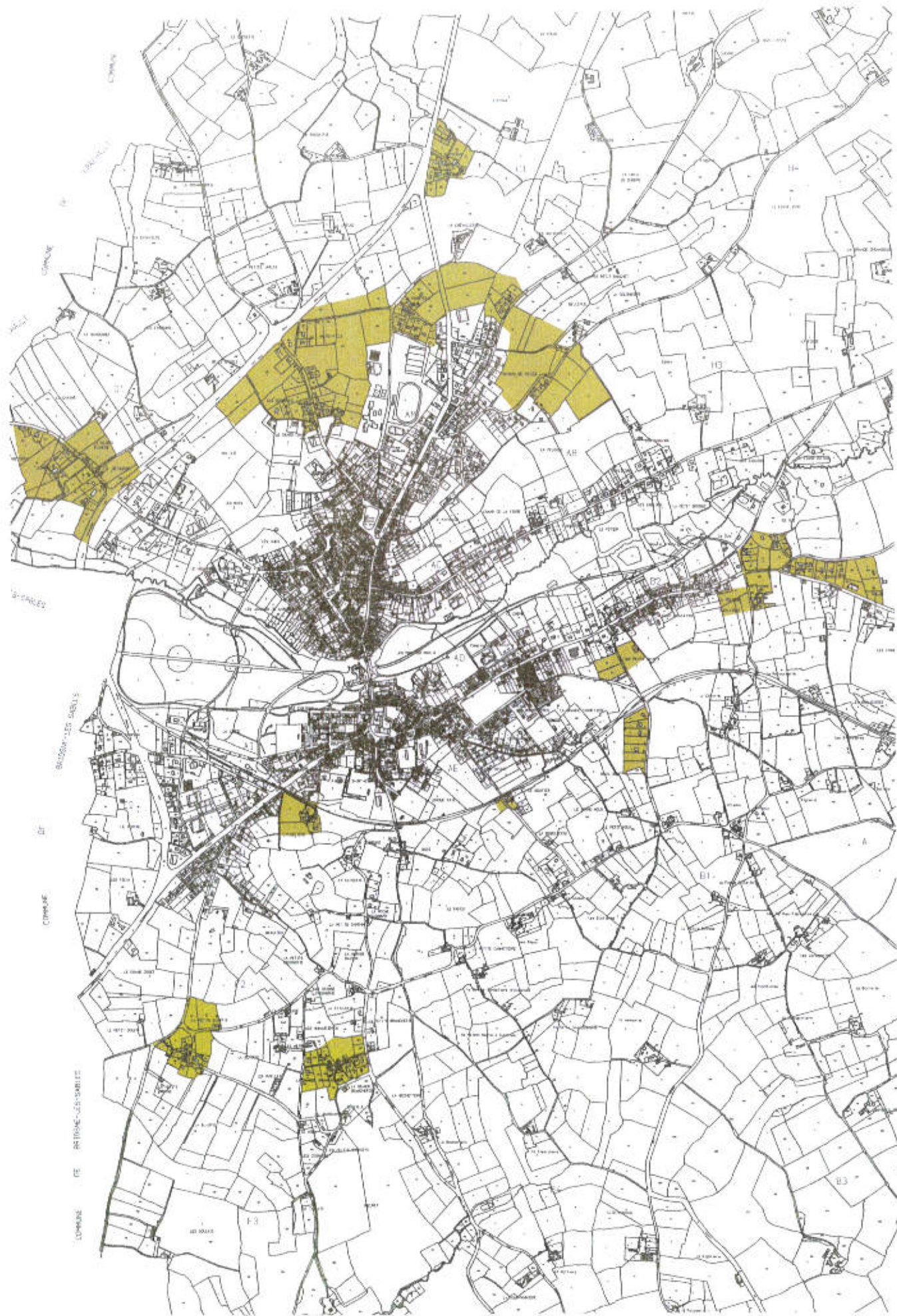
DANS LE PLU