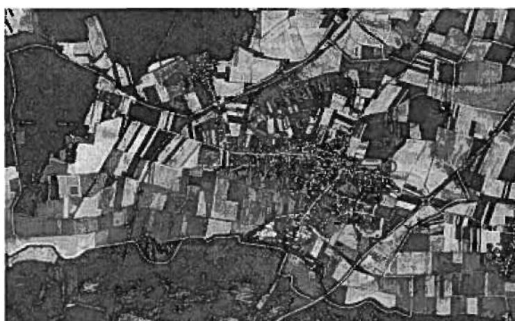
Figure 8 : le mitage du paysage

La commune souhaite lutter contre ce mitage du paysage, en évitant l'implantation des bâtiments agricoles en secteurs exposés et en encourageant la mise en place d'écrans végétaux.