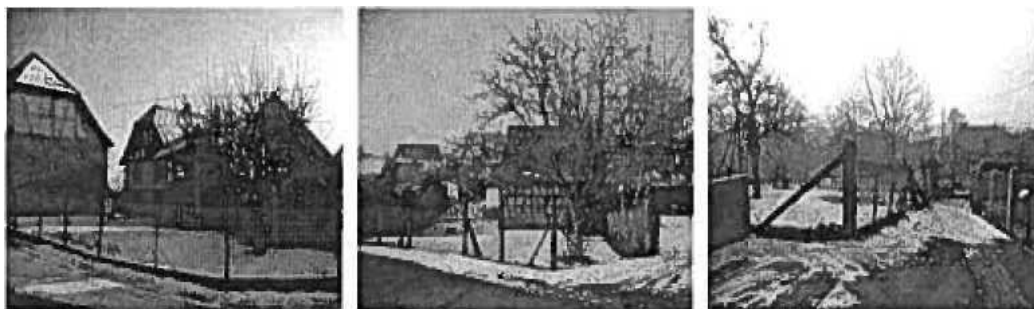
Figure 5 : les respirations du tissu traditionnel

Parallèlement, dans les secteurs à construire où la présence d'arbres ne doit pas être un frein aux projets des privés, les arbres n'auront pas l'obligation d'être préservés mais des dispositions réglementaires devront être prises afin que soit assurée une replantation sur la parcelle.