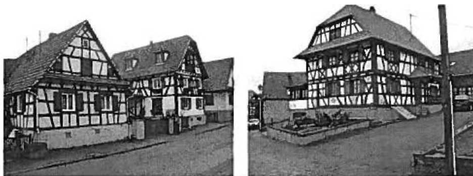
Figures 10 : maisons de la « Reconquête »

Texte sous réserve (voir prochainement avec l'ABF pour le principe)