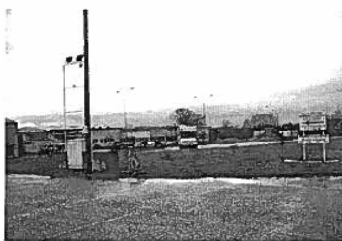
Figure 13 : zone d'activité à l'entrée de la commune, route de Schwabwiller