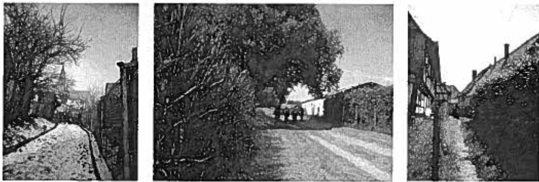
Figure 11 : différents cheminements doux

La commune souhaite les maintenir, les conforter, voire les compléter quand l'opportunité se présente, dans les zones à urbaniser ou les quartiers déjà constitués.