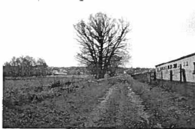
Figure 1 : Club house

Ces espaces de détente sont porteurs de redynamisation de la vie locale et présentent un potentiel appréciable en termes d'espaces verts de qualité. La commune souhaite raccrocher cette zone à l'urbanisation, aussi bien pour des questions de fonctionnement que d'image.