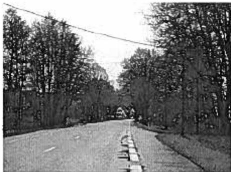
Figure 6 : l'entrée Sud de Surbourg