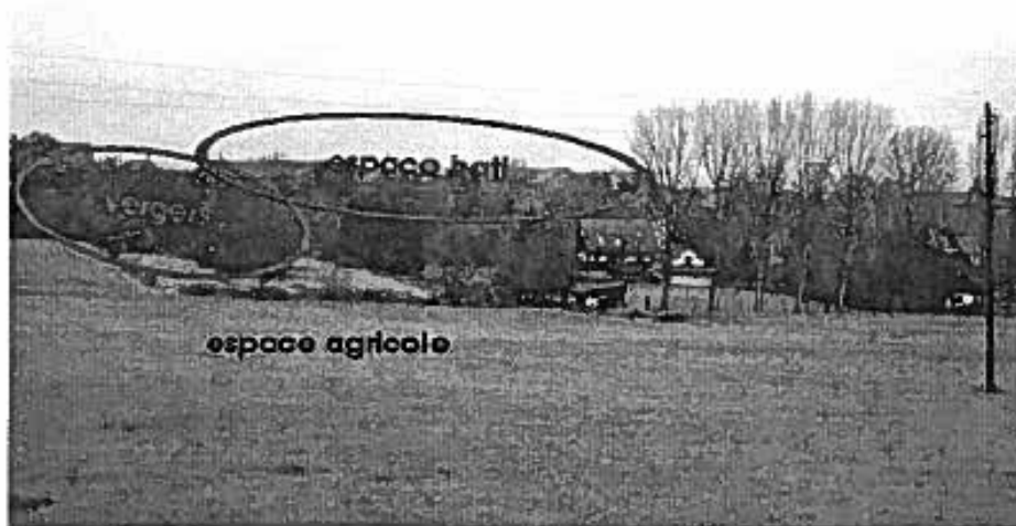
Figure 3 : les espaces de transition entre le bâti et les espaces agricoles jouent un rôle important dans l'organisation de la commune.

Au-delà de la qualité paysagère importante pour les riverains, ces espaces de vergers jouent un rôle d'écran paysager, isolent les constructions des intempéries (pluie et vent) et participent à la stabilisation des sols.