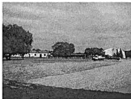
Figure 7 : la zone de loisirs de Surbourg