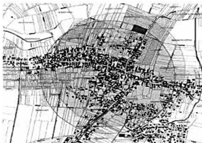
Figure 9 : périmètres actuels de protection des deux monuments historiques

Aussi, dans le cadre de l'élaboration du Plan Local d'Urbanisme, la commune souhaite engager une réflexion pour redéfinir les limites de ces périmètres de monument historique en collaboration étroite avec l'Architecte des Bâtiments de France, et ce, en vue de les adapter au contexte patrimonial urbain et topographique local.