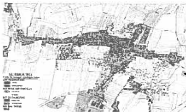
Figure 2 : Schéma de la structure urbaine de Surbourg

Les élus souhaitent stopper cette course en avant coûteuse en termes de foncier et d'équipements (voiries à aménager et à entretenir, linéaires de réseaux plus importants) et recentrer l'urbanisation pour lui donner une forme plus compacte. Il s'agit donc de relier les espaces bâtis entre eux afin de créer des enveloppes urbaines cohérentes, tendance qui a déjà été amorcée au Sud de la rue de la Paix ainsi qu'entre la rue de Schwabwiller et la rue du Général de Gaulle. Par la délimitation de limites claires, les entrées de la commune seront également traitées car mieux identifiées et marquées.