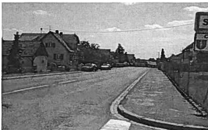
Figure 12 : entrée Nord-Est de Surbourg

Dans ce cadre, une attention particulière pourra également être portée à l'entrée Nord-Est de Surbourg où le traitement de la voie relève davantage de la route que de la rue, engendrant une vitesse moyenne des véhicules excessive et offrant peu d'opportunités aux riverains de s'approprier l'espace public.