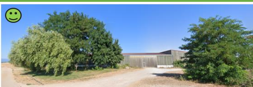
Bonne intégration des bâtiments liée à la présence d'arbres servant de transition paysagère

La réalisation de haies diversifiées passe par un mélange de différentes strates combinant strate arborée, strate arbustive et strate herbacée.