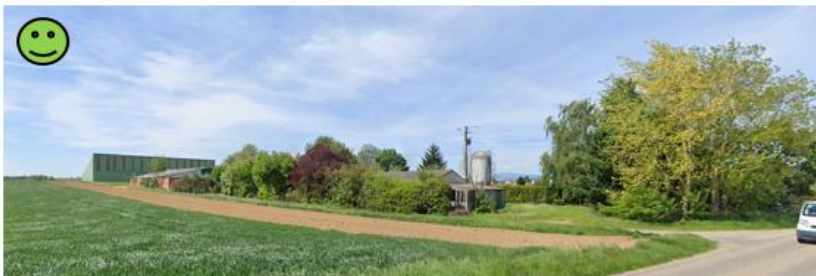
Excellente intégration des bâtiments liée à la présence d'arbres et strates arbustives variées servant de transition paysagère