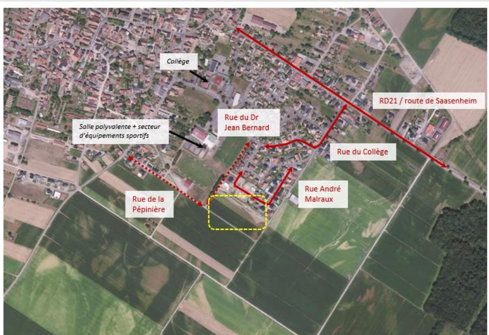
Localisation du secteur 1AU « rue André Malraux »

La superficie du secteur 1AU est de 1,6 ha.