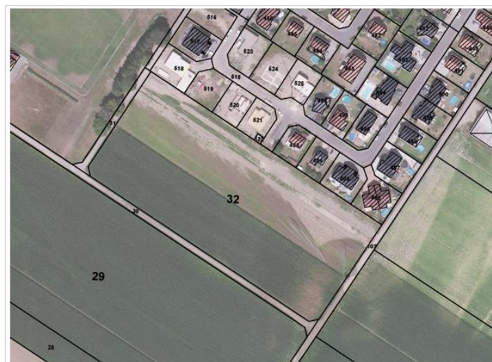
Secteur 1AU « rue André Malraux »

prise de vue 2018