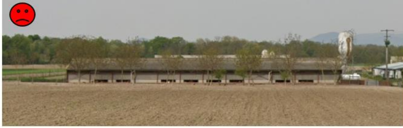
Transition paysagère peu efficace constituée d'arbres à haute tige trop poreux visuellement et absence de strate basse