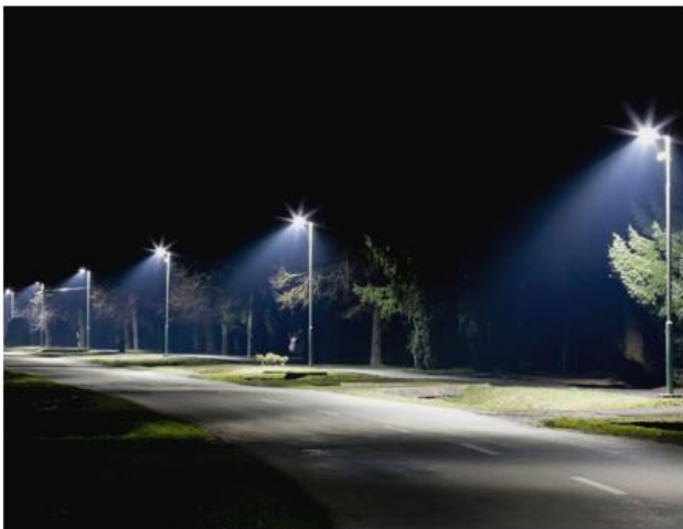
Illustration d'éclairage directionnel

Afin entre autres de limiter les nuisances envers les espèces nocturnes, les projets doivent favoriser une réduction des éclairages extérieurs en intensité et en durée et privilégier des éclairages directionnels.