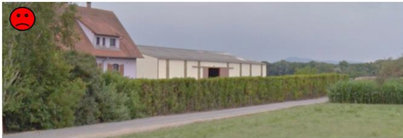
Transition paysagère monotone constituée de plantations linéaires monospécifiques