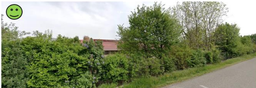
Transition paysagère réussie constituée d'essences variées comportant différentes strates