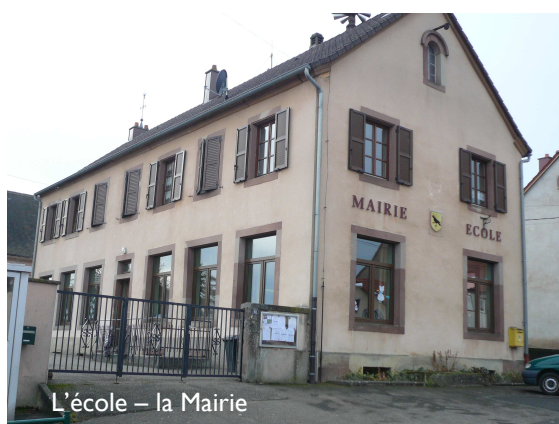
L'école – la Mairie