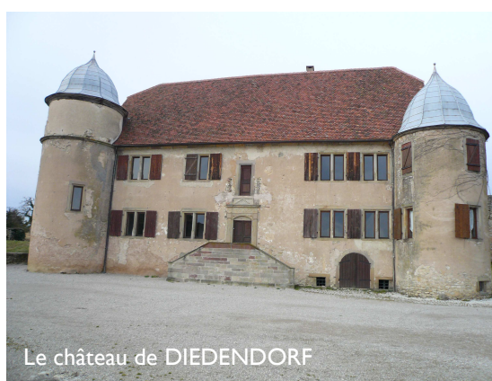
Le château de DIEDENDORF