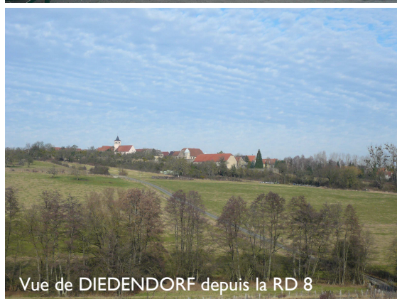
Vue de DIEDENDORF depuis la RD 8