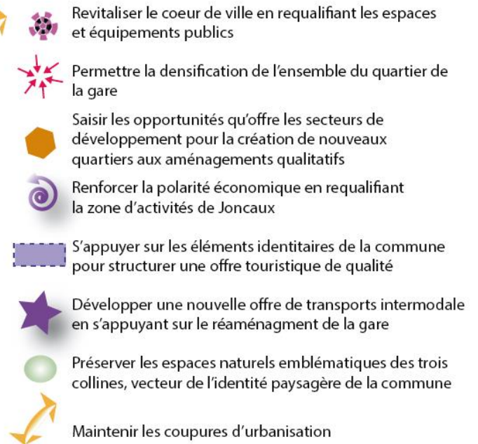
Carte illustrative des orientations générales