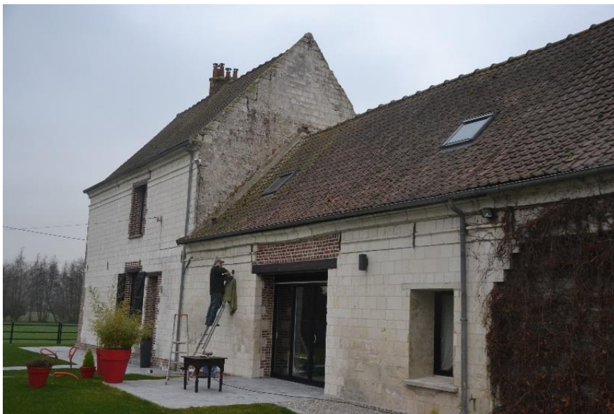
Figure 12 : Vue depuis la cour

A moins d'un impératif technique justifié (désordre irréversible), le recouvrement des façades et pignons visibles depuis l'espace public est interdit. De même, le remplacement des matériaux composant les façades et les pignons visibles depuis l'espace public ne peut être effectué qu'avec des matériaux de même nature ou de même aspect, hormis lorsque le projet s'attache à la suppression de désordres architecturaux. Dans ce dernier cas, le projet doit s'attacher à restituer un aspect final compatible avec les caractéristiques architecturales représentatives de la période d'édification du bâtiment.