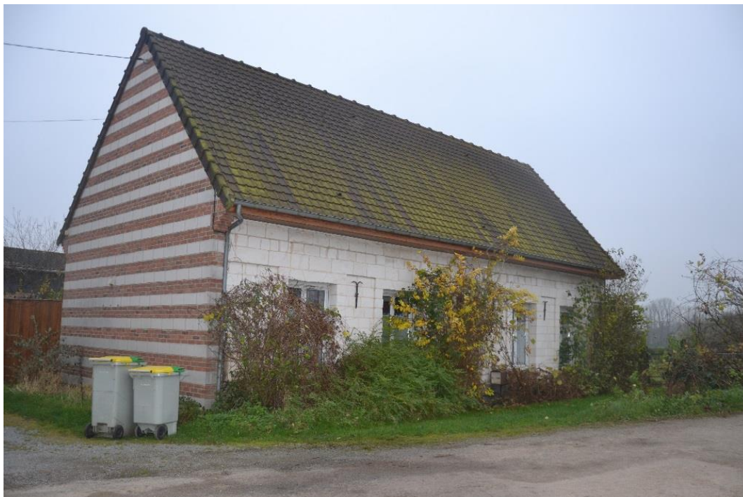
Figure 10 : Vue depuis la voie