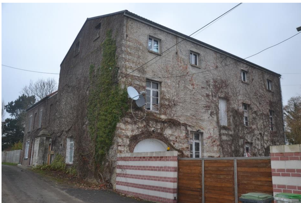
Figure 16 : Vue de l'atelier de fabrication depuis la voie