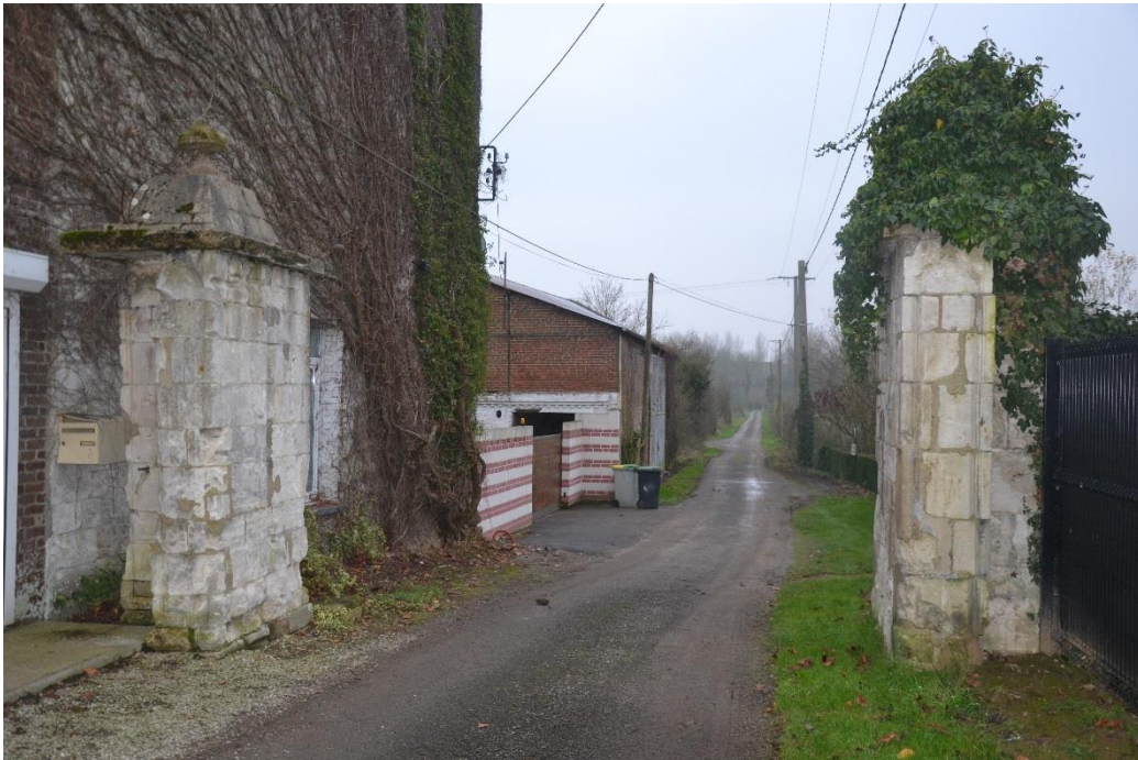
Figure 14 : Vue des pilasses