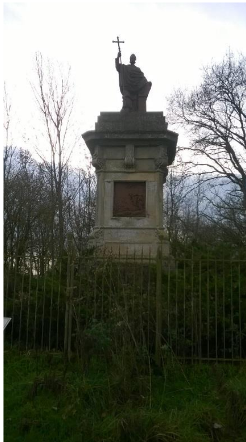
Figure 17 : Vue de la statue