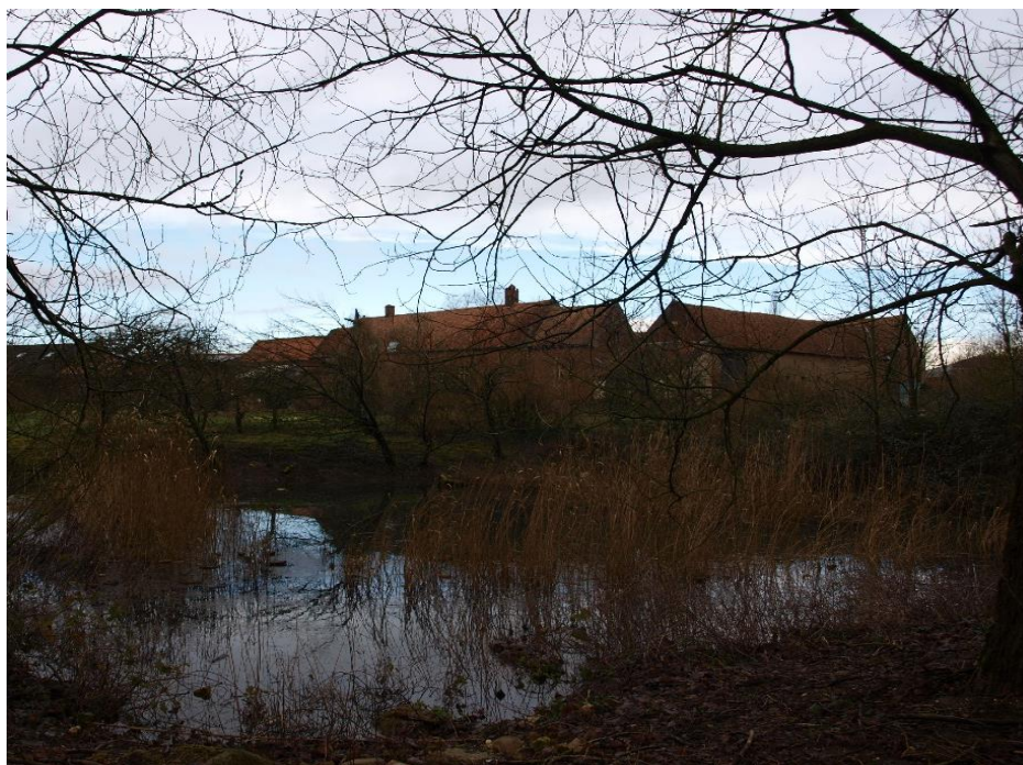
Figure 6 Vue des anciens fossés