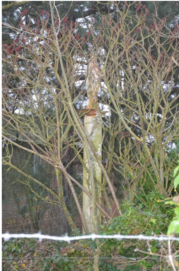
Figure 15 : Vue de la colonne depuis la voie