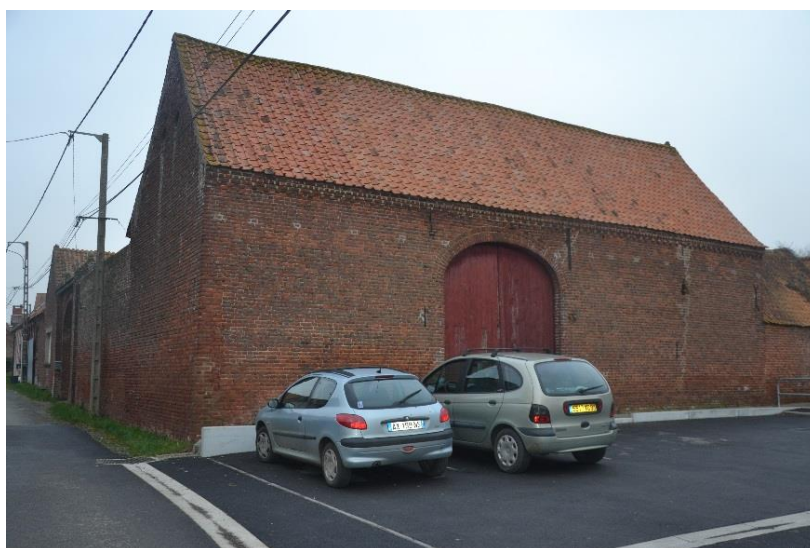
Figure 7 Vue de la ferme depuis l'ancien flégard