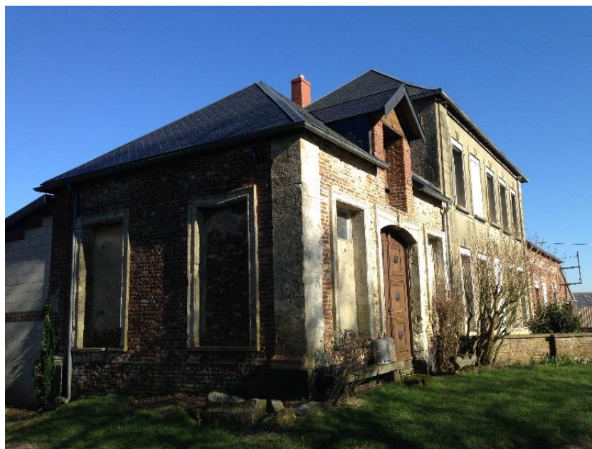
Figure 18 : Vue du pavillon ouest