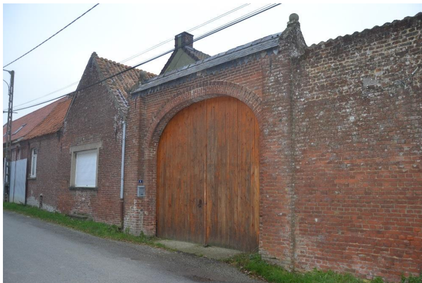
Figure 8 Porche implanté le long de la rue Haute