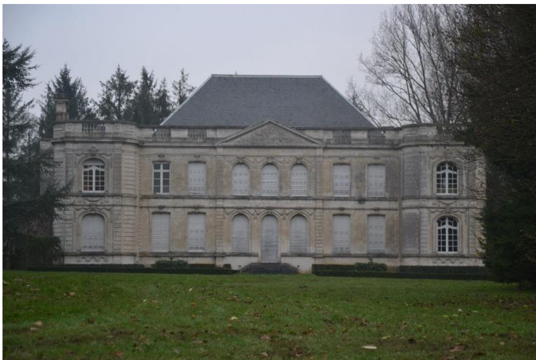
Figure 9 Vue du château depuis la rue d'Aire