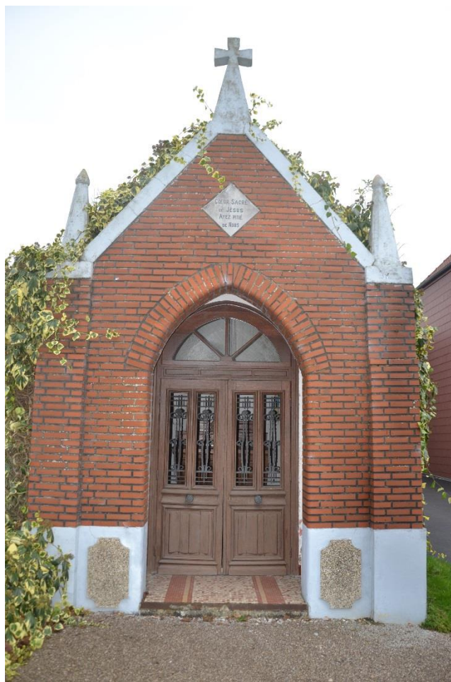
Figure 1 Chapelle, vue de face Prescriptions spécifiques à la chapelle Notre-Dame de Lourdes