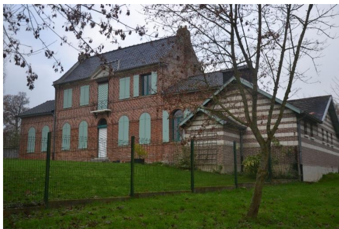
Figure 3 Vue de la façade arrière du presbytère