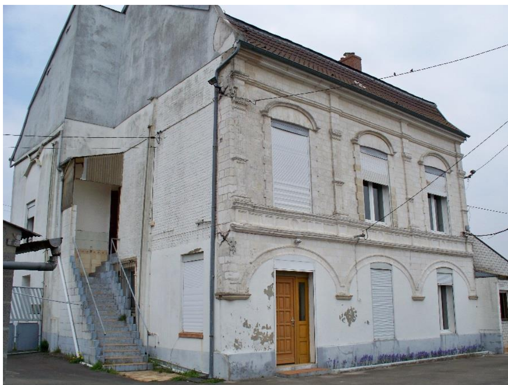
Figure 11 : Vue de la façade sud