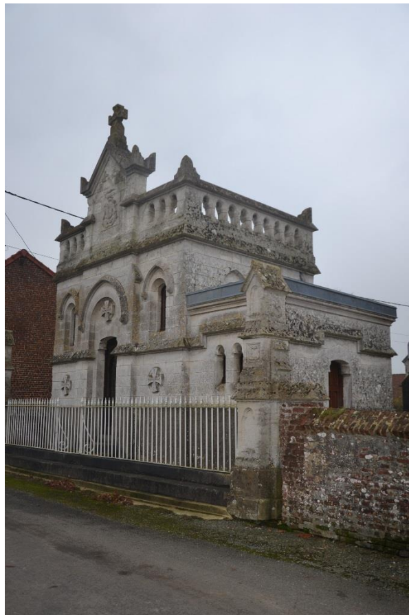
Figure 4 Chapelle Titelouze de Gournay