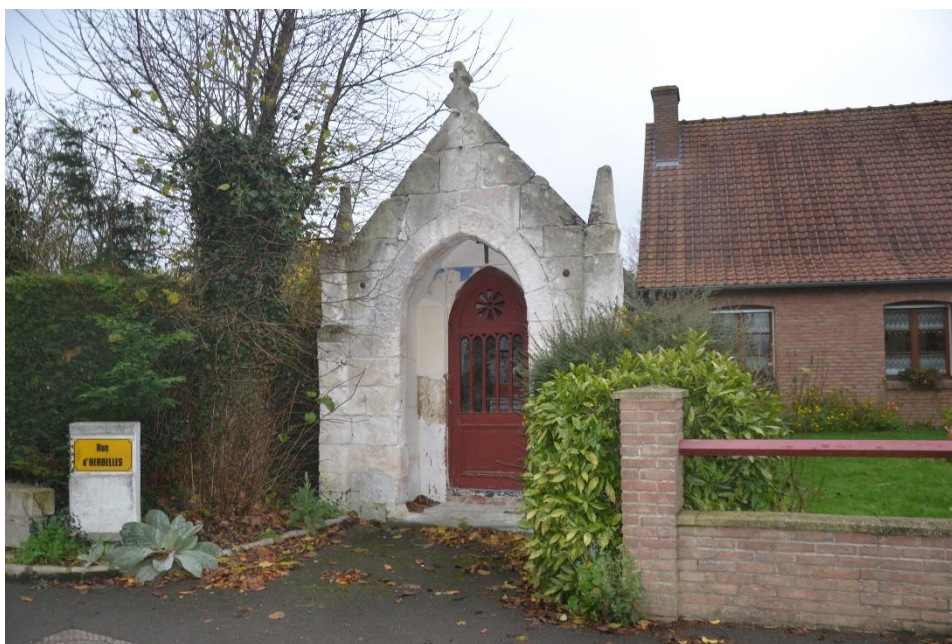
Figure 2 Chapelle Notre-Dame de Lourdes