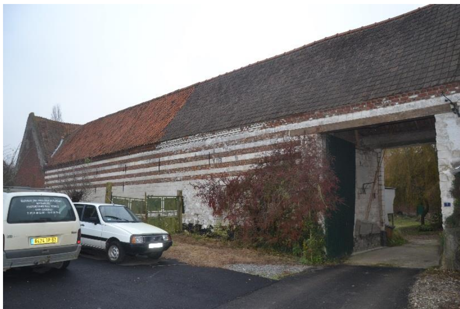
Figure 5 : Vue d'ensemble du corps de ferme