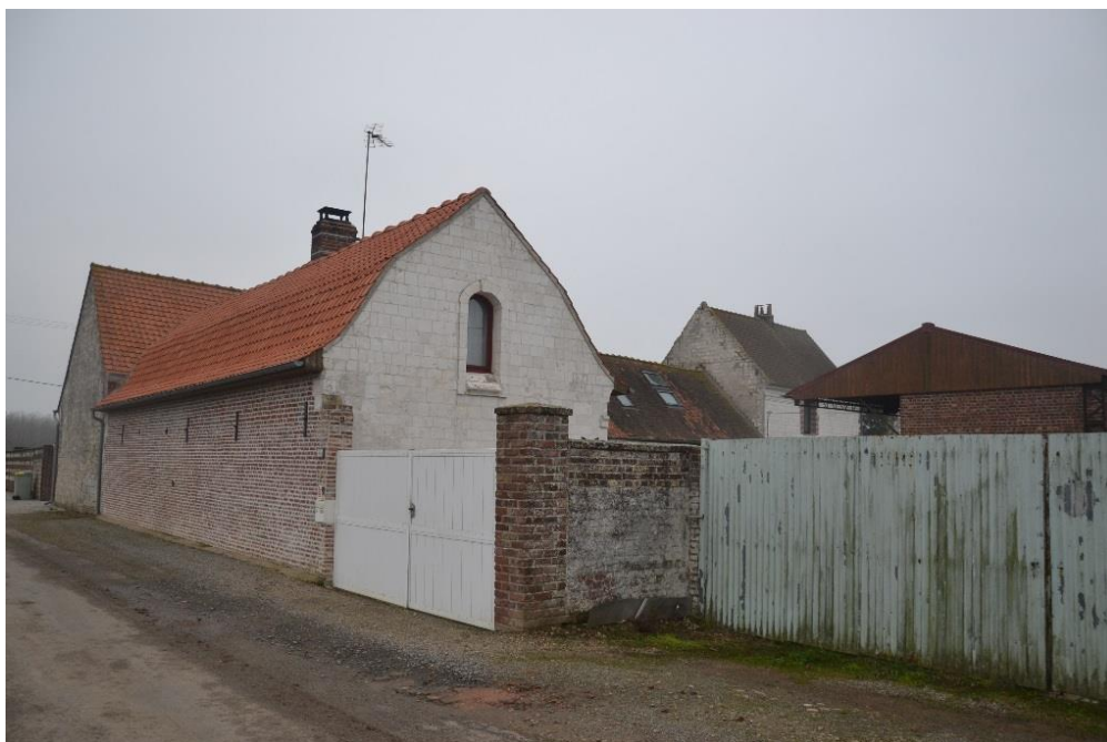
Figure 13 : Vue depuis la voie