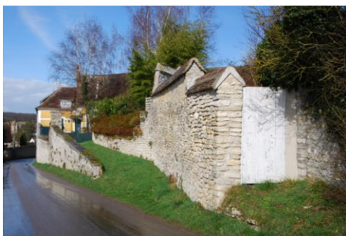
mur en pierre calcaire