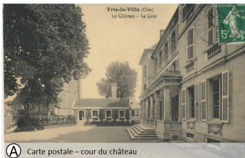
(A) Carte postale – cour du château