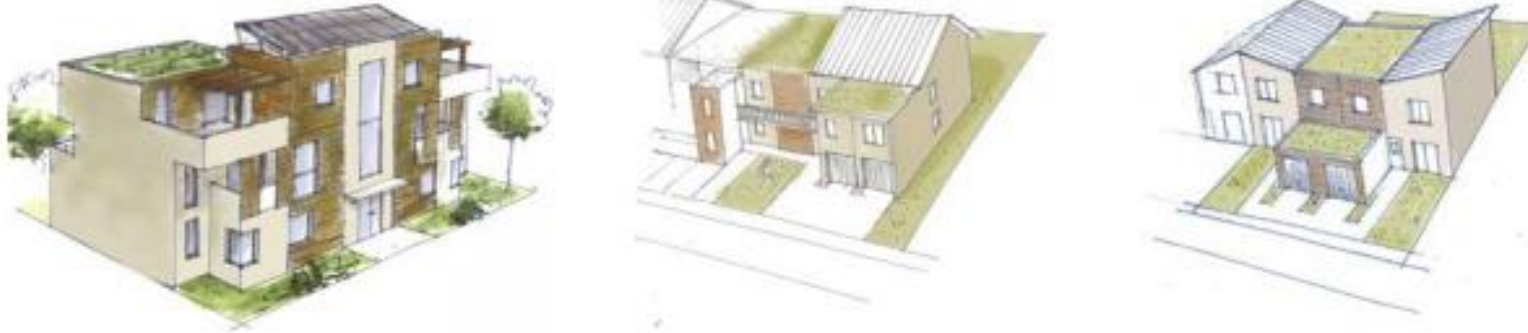
Exemple de formes urbaines possibles pour des projets d'habitat collectif, d'habitat intermédiaire et d'habitat individuel groupé.

Dans un souci de développement durable et de confort des résidents, une attention particulière devra être portée lors de la conception et la réalisation des logements à :