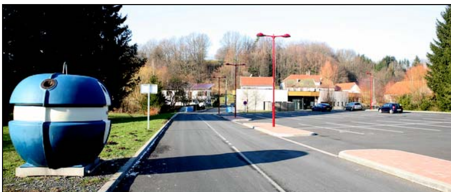
L'aménagement d'un parking derrière le offre des possibilités de stationnement à proximité immédiate du multiservice. Ce type d'opération doit être poursuivi et répondre à de multiples usages (stationnement, espace public, place des fêtes...)

L'offre en stationnement doit être améliorée par le réaménagement des espaces publics (places, routes...) et éventuellement par l'acquisition de parcelles permettant de créer des petites unités de stationnement.