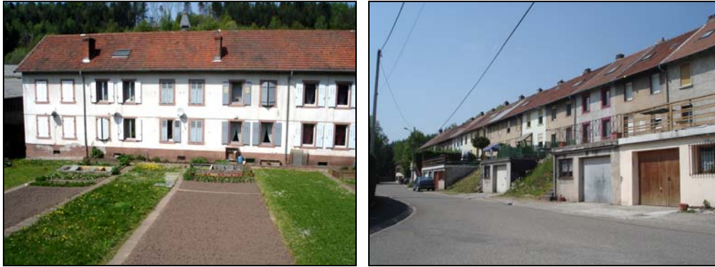
La morphologie et les caractéristiques architecturales de l'habitat ouvrier à Vallerysthal méritent également des dispositions spécifiques.

La valorisation de ces différents patrimoines pourra passer par une amélioration de la qualité des espaces publics et de l'habitat.