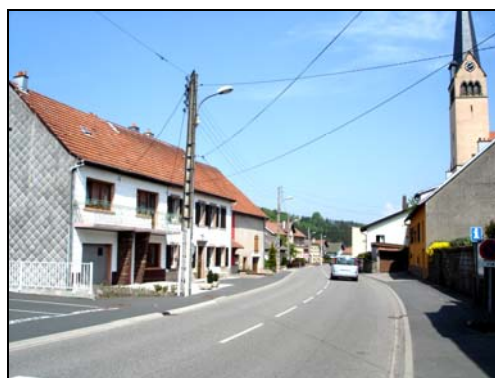
La morphologie et les caractéristiques architecturales des centres anciens méritent des dispositions spécifiques.

En dehors des espaces centraux, certains quartiers plus récents présentent également une homogénéité et une cohérence architecturale propre (exemple : le Parc) qui méritent d'être perpétuées par des dispositions propres.