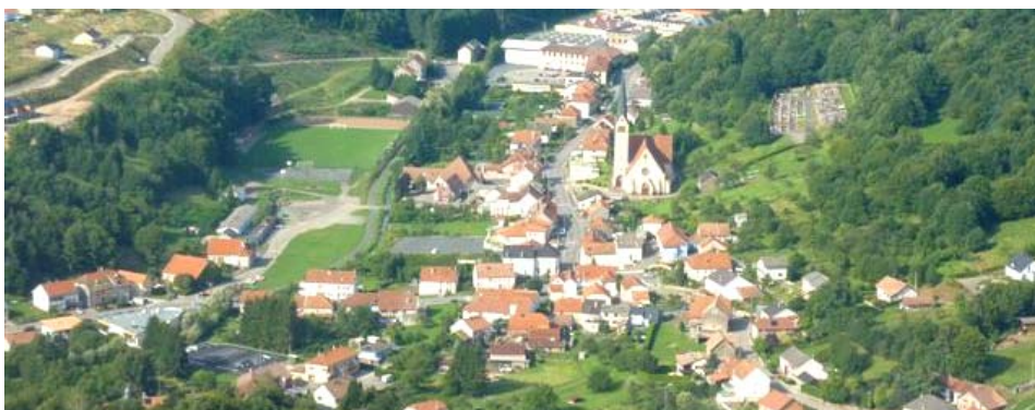
Les flancs de colline à reconquérir

Le maintien de la trame verte et bleue doit prendre en compte ce problème d'envahissement par les friches qui nuit à l'environnement paysager immédiat du village. Aussi, les mesures conservatoires du PLU dans la vallée seront adaptées, de façon à ne pas empêcher d'éventuels défrichements. La commune veillera toutefois à ce que ceux-ci ne nuisent pas outre mesure aux entités paysagères présentant un intérêt concernant le caractère champêtre du village (jardins, vergers, haies).