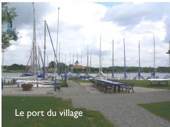
Le port du village