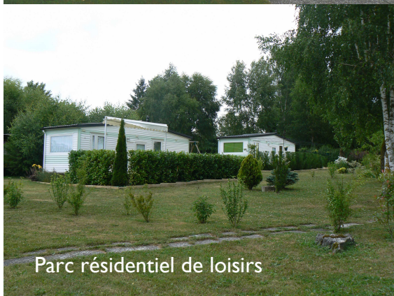
Parc résidentiel de loisirs