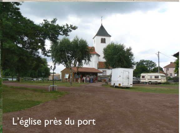
L'église près du port