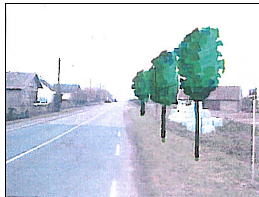
Proposition d'aménagements des entrées du village sur l'ancien tracé de la R.N.4 (CAUE 57).