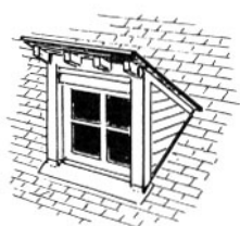
lucarne retroussée , ou demoiselle ; c'est aussi le vrai chien-assis (Source : DICOBAT)

Lucarne à toit retroussé, c'est-à-dire dont la pente est opposée à celle de la toiture.