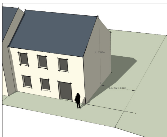
Exemple d'implantation L \geq H/2 , à titre indicatif.

7.2.1. Les prescriptions générales peuvent ne pas s'appliquer pour l'extension d'une construction existante ne respectant pas la règle générale, dès lors que l'extension est réalisée dans son prolongement, sans restreindre le retrait séparant la construction existante de la limite séparative et sans dépasser sa hauteur de faîte.