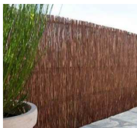
Clôture en canisse