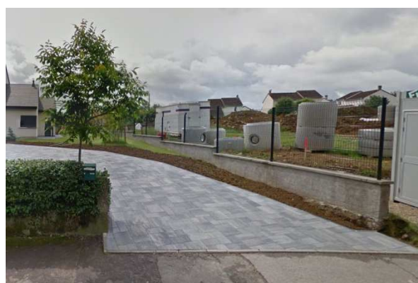
Clôture muret surmontée d'un grillage