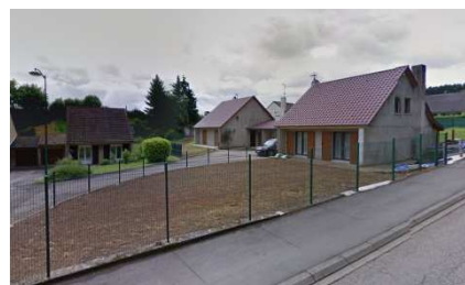
Clôture en grillage