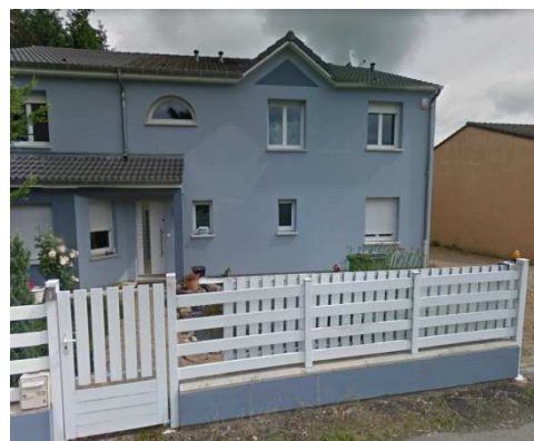
Clôture à claire-voie