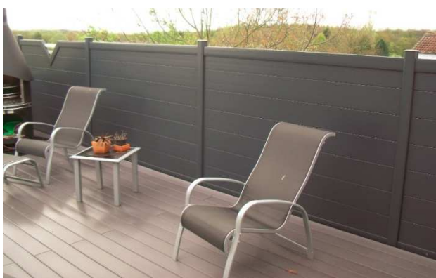
Clôture en panneaux pleins