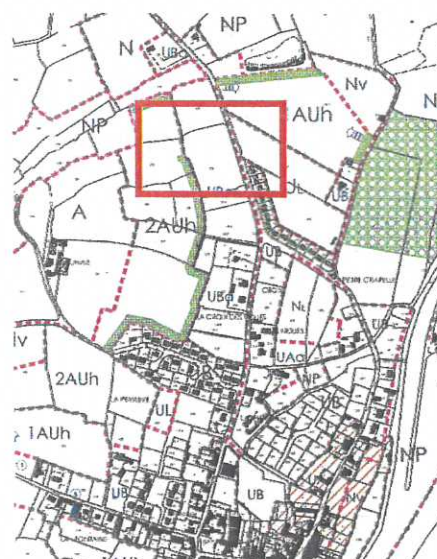
modification n°1 du PLU