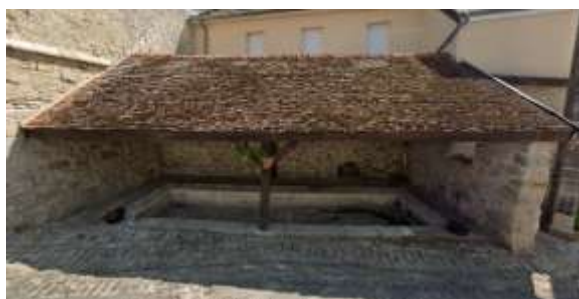
Le lavoir public de la rue principale