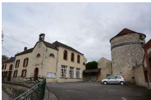
Le Pigeonnier au centre du village

⇒ La commune souhaite préserver plusieurs éléments de son patrimoine local :