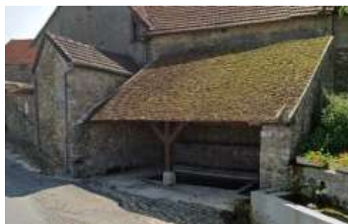
Le lavoir public du hameau de Trotte