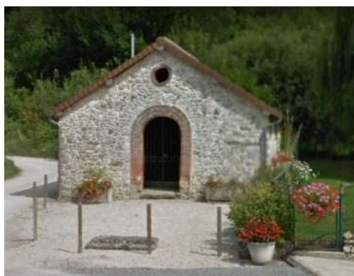
Le lavoir public rue Gamache