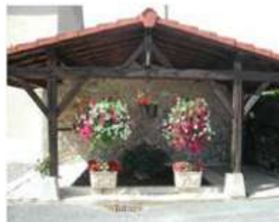
Le lavoir public de la Tuilerie