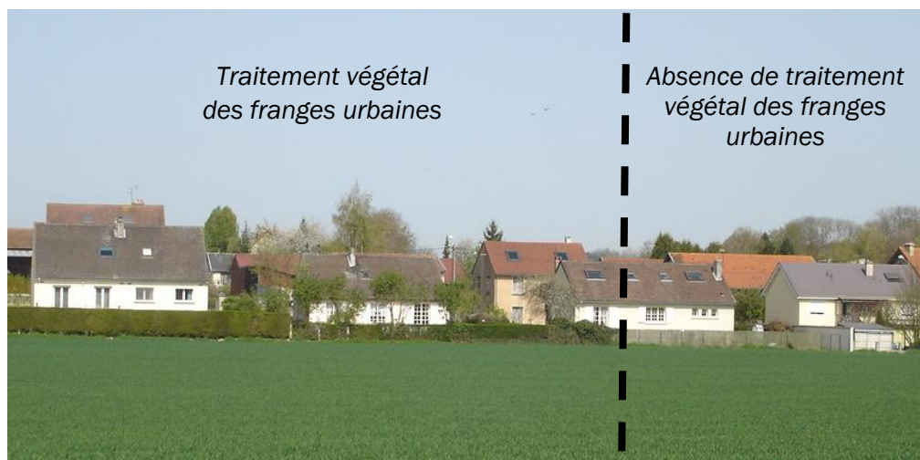
Arrière des constructions, rue Marin de la Meslée à Courcy

Il s'agit de maintenir ces éléments environnementaux au sein de l'espace urbain afin de garantir une biodiversité caractéristique du milieu urbain et de réduire l'imperméabilisation des sols.