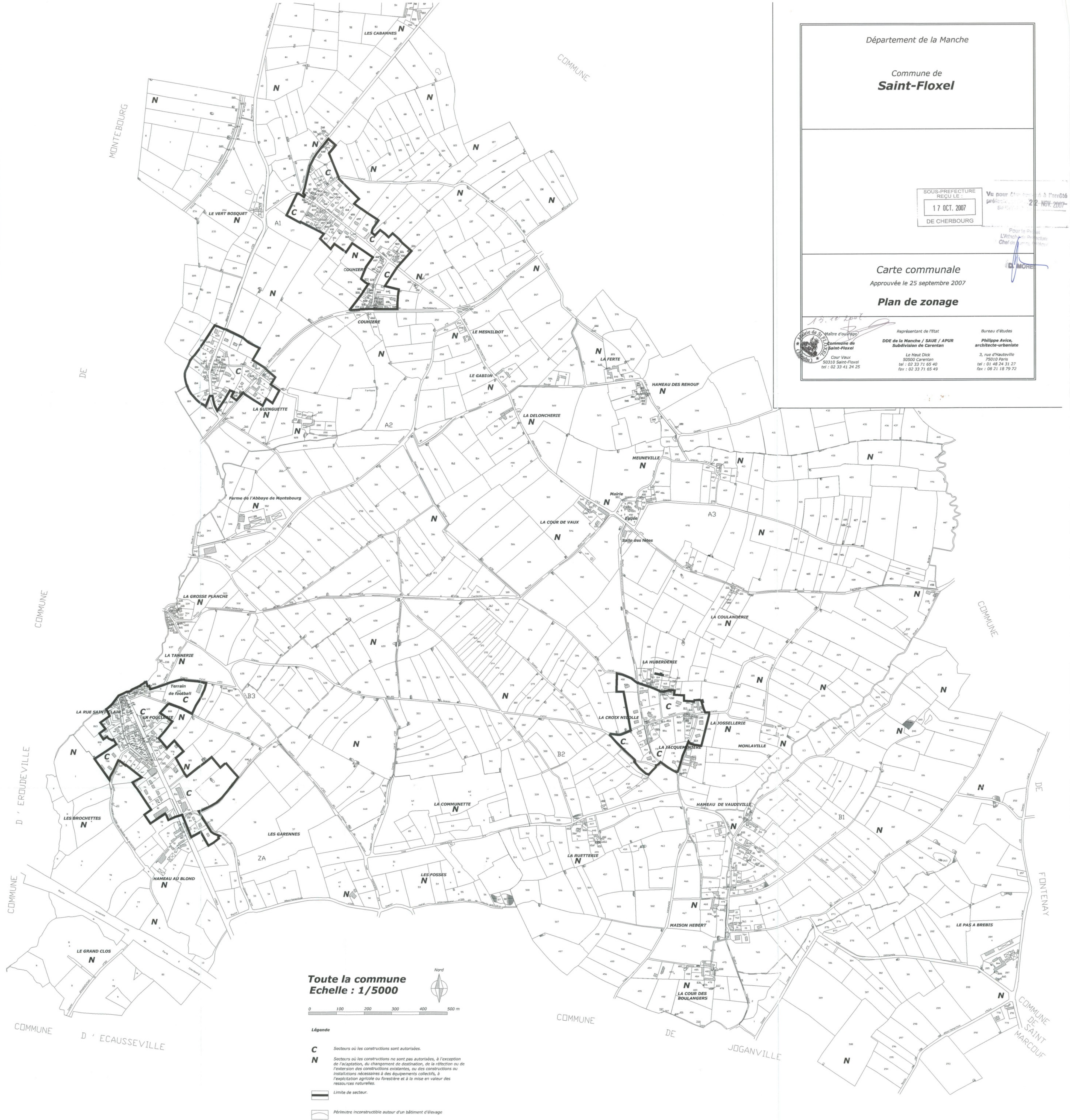
Toute la commune Echelle : 1/5000