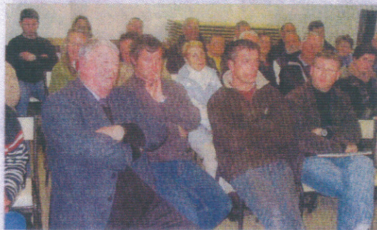
La première étude a été présentée par le cabinet Potier-Du Bours. Elle sera affichée durant un mois.

Plan d'urbanisme : vers une urbanisation raisonnée