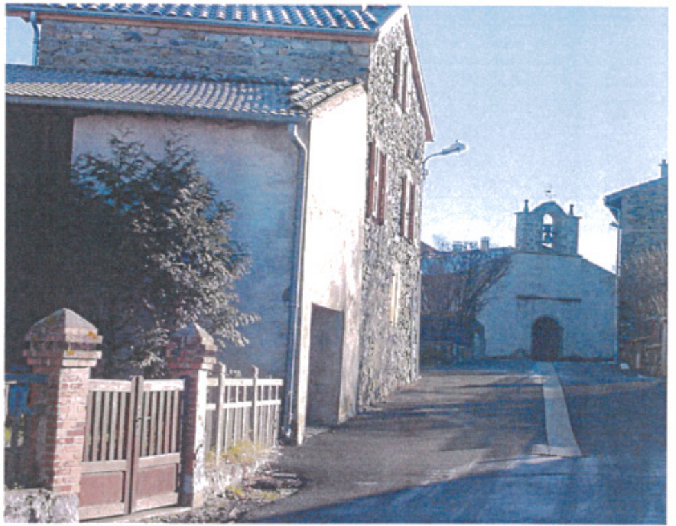
L'Eglise et le bourg