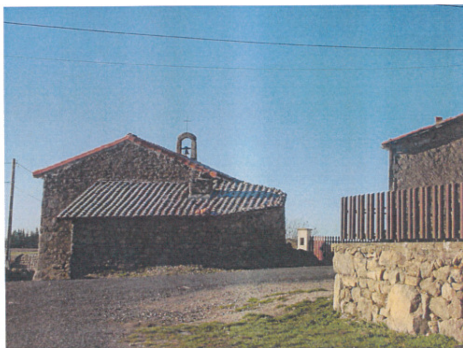
L'assemblée de Dignac