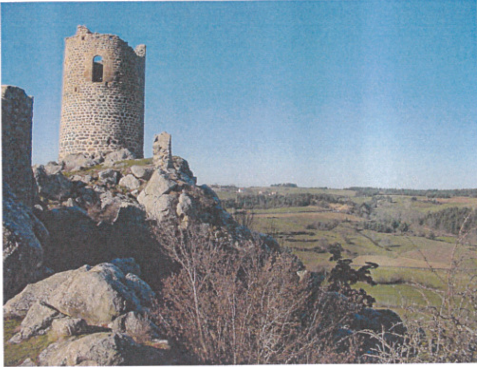
Le Bourg et la tour