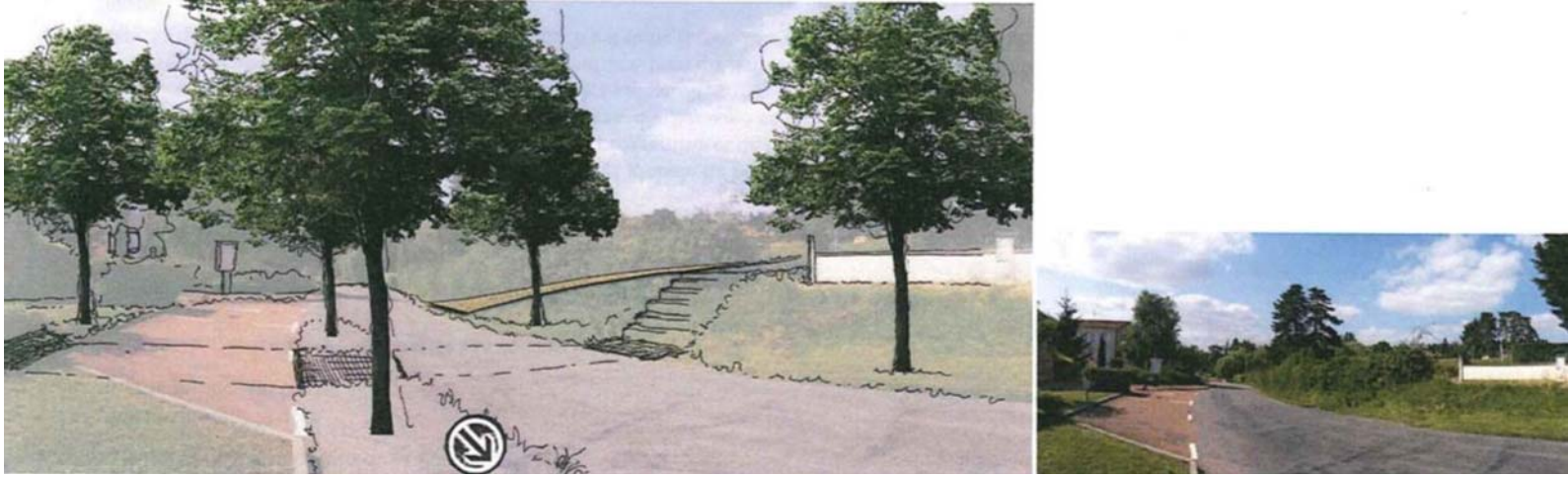
Exemple d'aménagement de la voie communale n°3