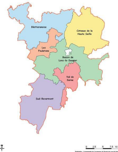
L'intercommunalité du SCOT du Pays Lédonien