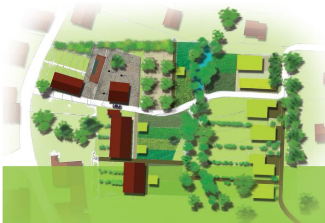
Plan projet non contractuel

Au sein de ce secteur, à deux pas de la mairie, un nouveau quartier doit voir le jour où prendront place des constructions à haute qualité environnementale.