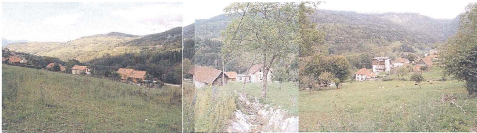
Le secteur concerné