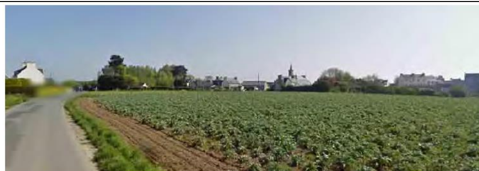
Vue depuis la rue de la Croix sur la zone et le cœur de bourg