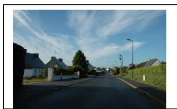
Le quartier de Kerfaen

La structure urbaine du quartier de Kerfaen correspond à une densité moyenne réalisée par à-coups ou par opportunités foncières.