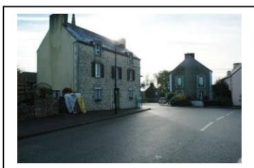
Un développement composant les unités urbaines – le centre bourg

Le territoire dispose d'un pôle urbain principal correspondant au centre bourg, qui concentre l'ensemble des services et équipements. Il s'agit de privilégier ce pôle en l'étoffant et éviter les étirements linéaires le long des axes de communication (RD 51 et 50).