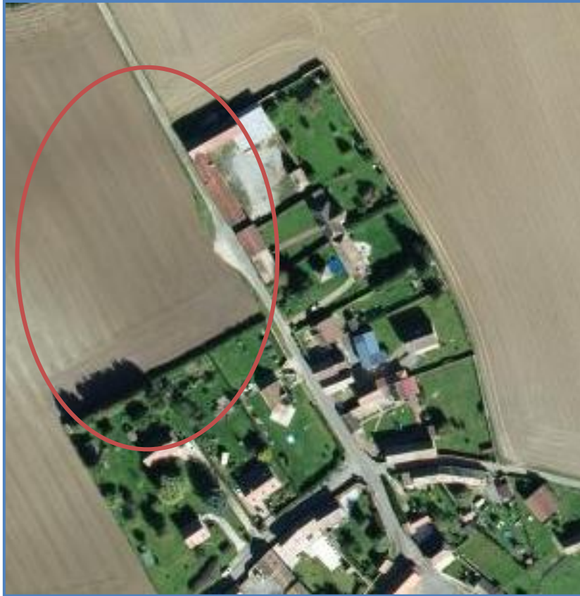
Image aérienne du site de l'OAP

Il s'agit d'un espace occupé par l'agriculture, il était enregistré en 2013 comme espace cultivé en blé tendre. Dans un environnement proche, le site se situe en limite du centre bourg.