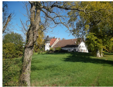
n° 21 -22