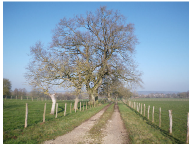
alignement la Vaivre 1