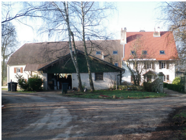
n° 21 -22