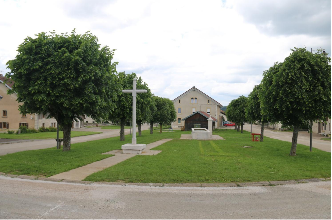
Nouvelle Photographie à jour

Nous avons ici également un monument regardant l'espace vert dégagé devant lui, espace également à l'avant de l'entrée de l'église.