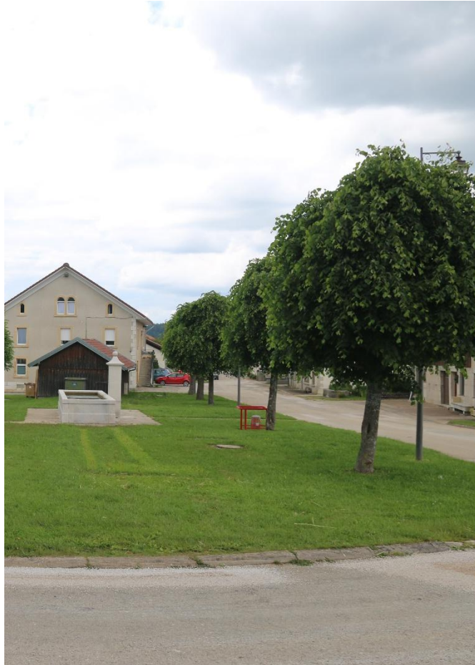
Nouvelle Photographie à jour

Cette fontaine est intéressante par sa présence au cœur d'un espace vert préservé dans le passé par son usage lié aux fermes situées de chaque côté de la voie qui en fait le tour.