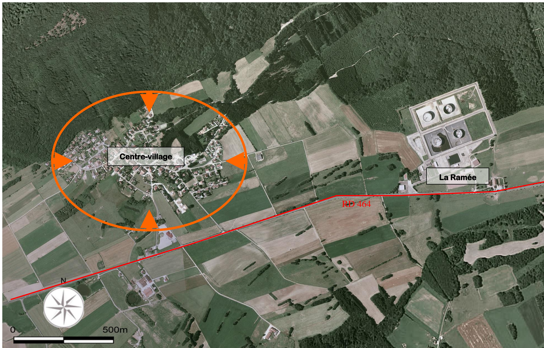
CARTE 1 : Des 2 hameaux urbanisés de la commune (le Bourg et La Ramée reliés par la RD464), un seul sera le théâtre du développement futur et recevra de nouvelles habitations : un resserrement urbain recherché.