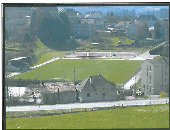
Les installations sportives actuelles à proximité du centre bourg

Un emplacement est pressenti aux alentours de la gare.