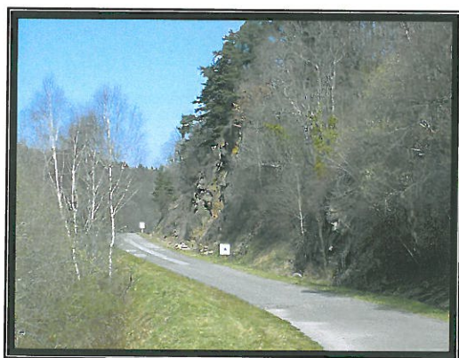
La route touristique des Combes