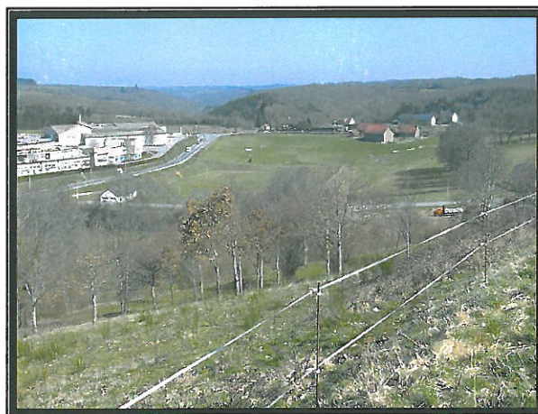
La coulée verte à l'entrée Nord de Felletin