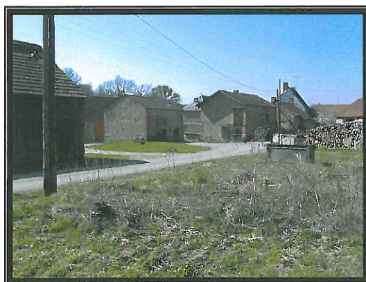
Le hameau de la Salle

Les différents hameaux ne seront pas cloisonnés en terme d'extensions. Cependant, il n'y aura pas d'opération programmée massive de construction au sein des villages.