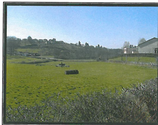
La coulée verte à l'entrée du bourg