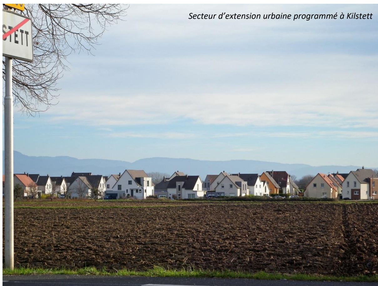
Secteur d'extension urbaine programmé à Kilstett