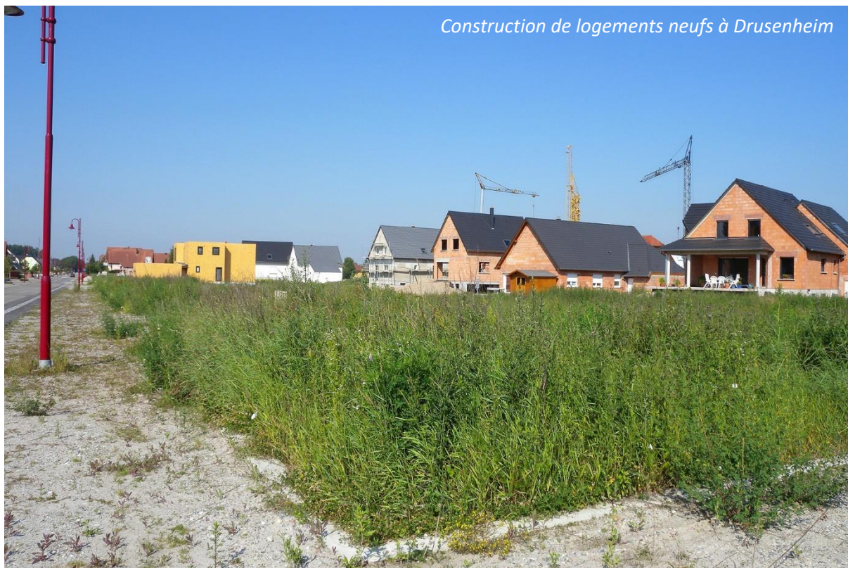
Construction de logements neufs à Drusenheim