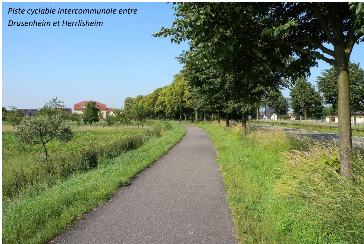
Piste cyclable intercommunale entre Drusenheim et Herrlisheim