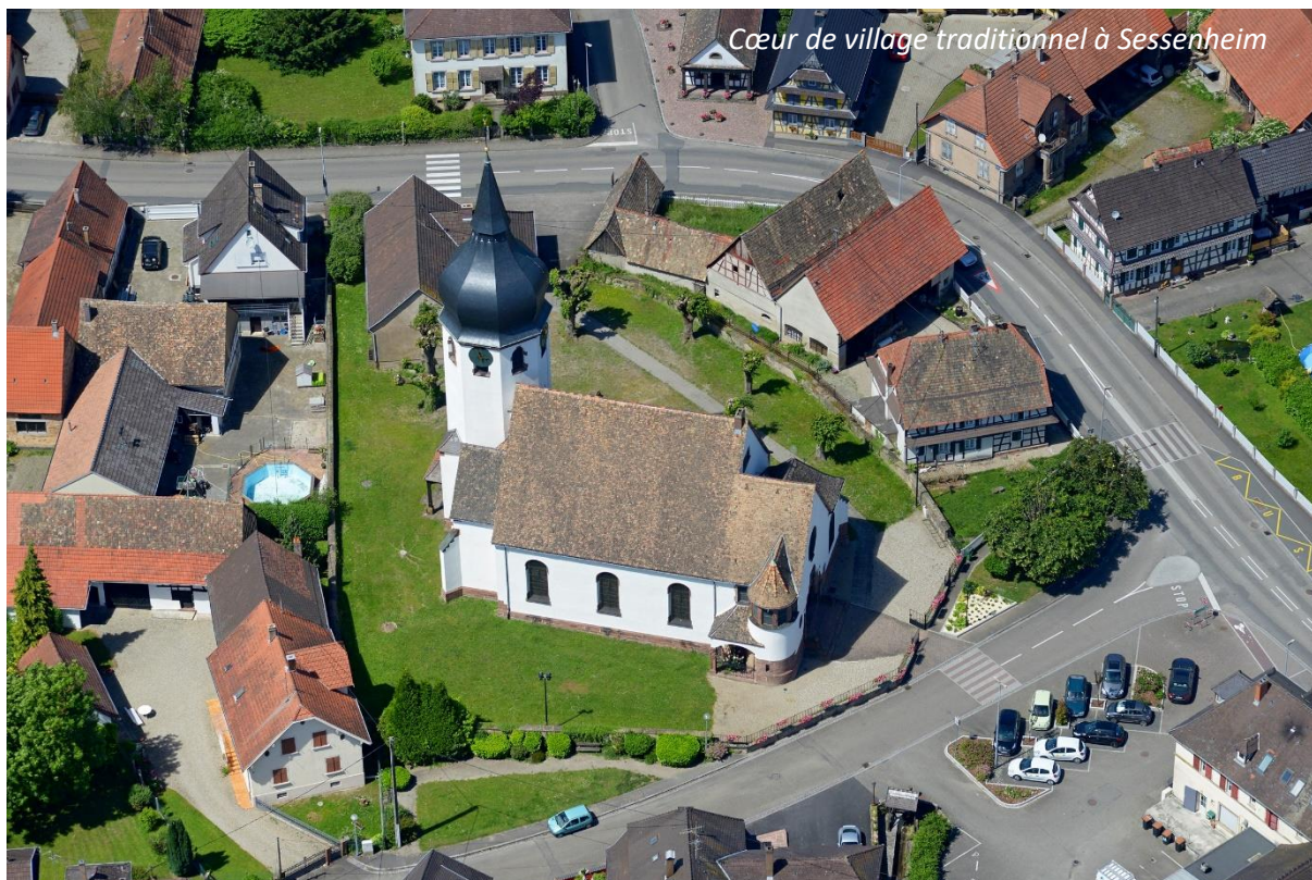
Cœur de village traditionnel à Sessenheim