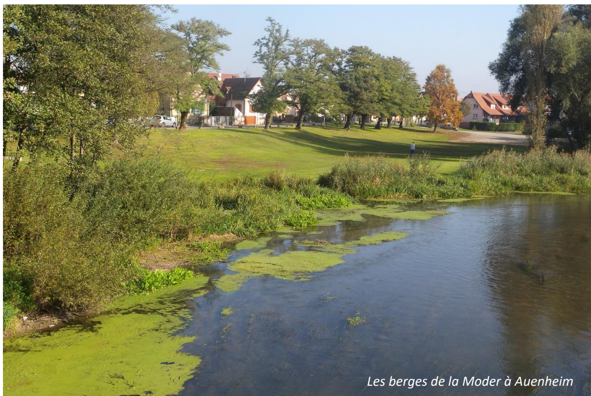
Les berges de la Moder à Auenheim