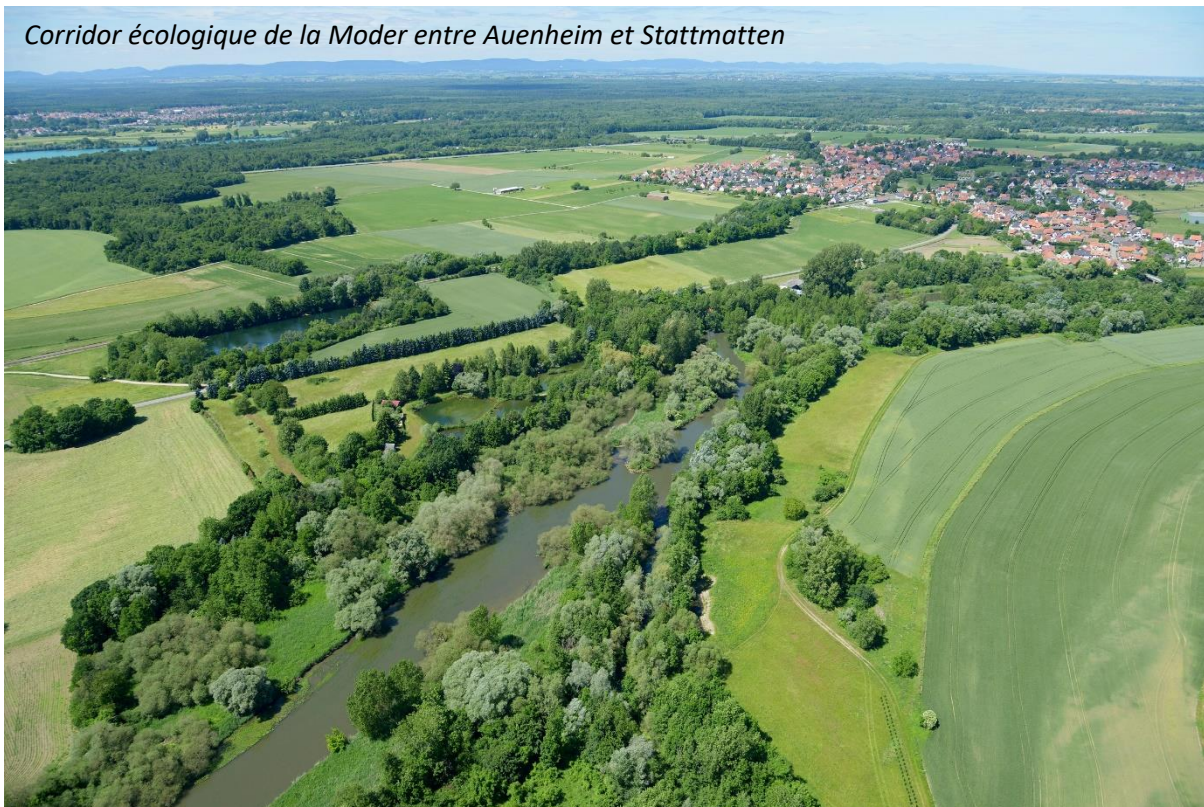
Corridor écologique de la Moder entre Auenheim et Stattmatten