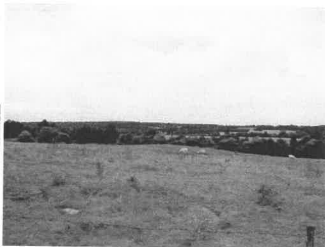
Coteau naturel, au nord de la route nationale