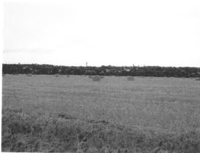
Plaine agricole du Cher, au sud