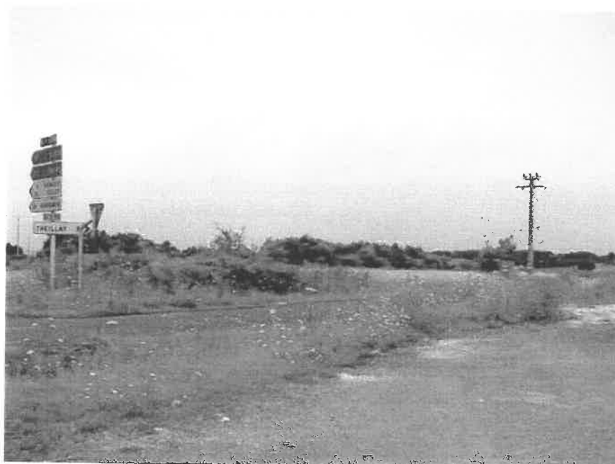
Localisation de la future zone artisanale

La route actuelle de Theillay serait donc déviée pour emprunter cette voie secondaire et sortir au giratoire, ce qui aurait également pour avantage de sécuriser la sortie qui actuellement manque de visibilité sur les véhicules arrivant de Tours.