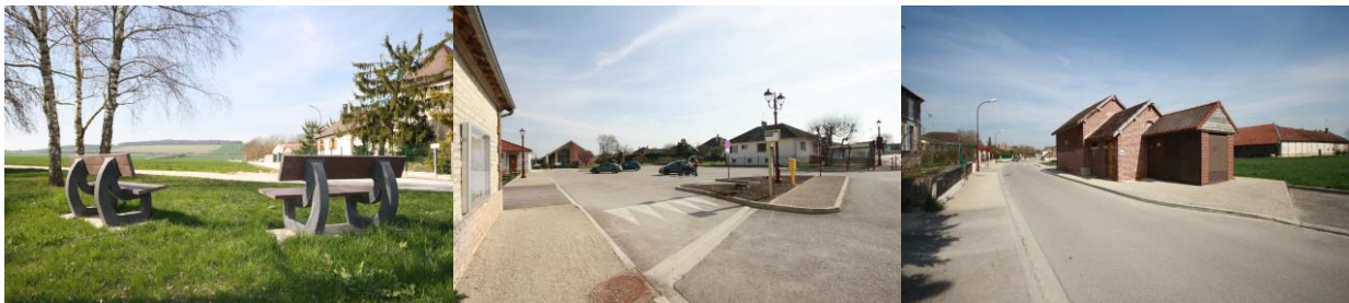
Espace vert Grande rue

La commune souhaite développer de nouveaux réseaux d'énergie afin de mixer les sources d'énergie en faveur de la réduction des émissions de gaz à effet de serre.