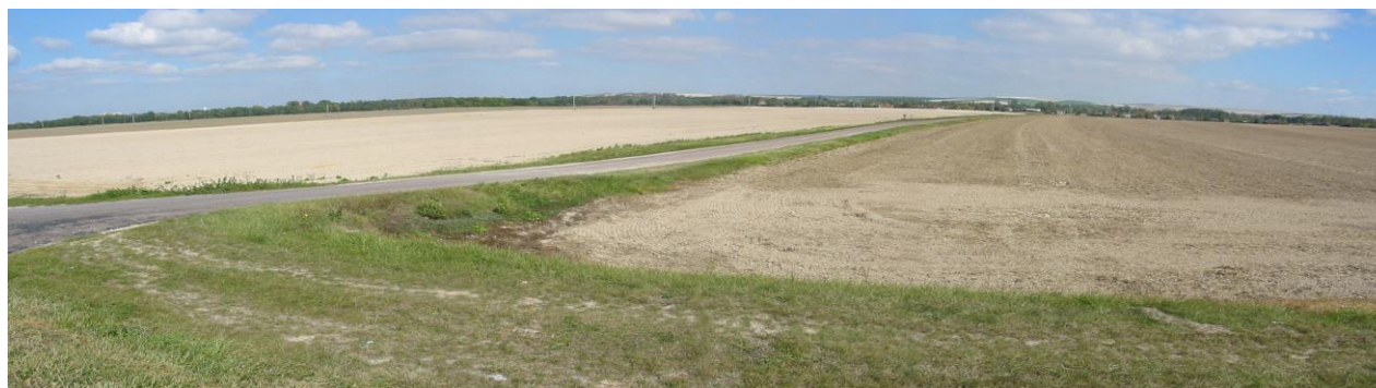
Paysage agricole vu depuis la R.D.619 en provenance de Troyes en direction du village