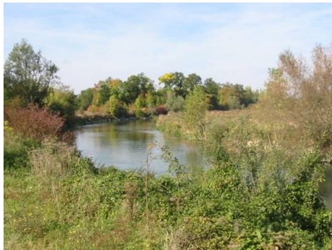
Vallée de la Seine depuis RD/Chauchigny