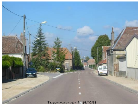
Traversée de la RD20