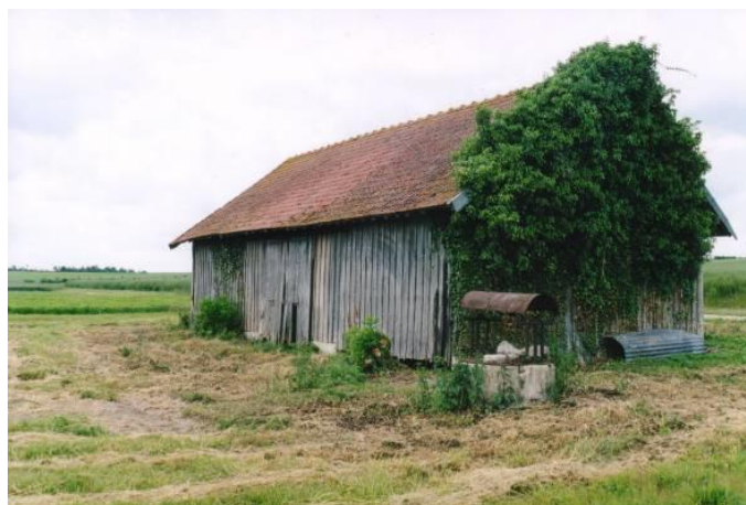
Cabane de champs au Sud-Ouest du territoire